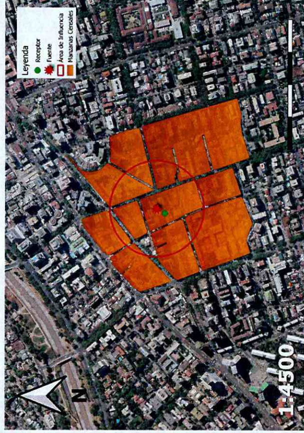
Imagen 1. Intersección manzanas censales y AI