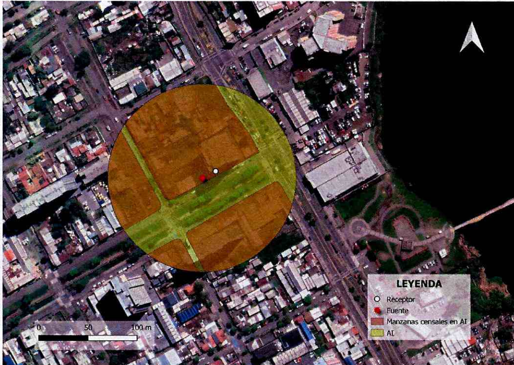
Imagen 1. Intersección manzanas censales y AI