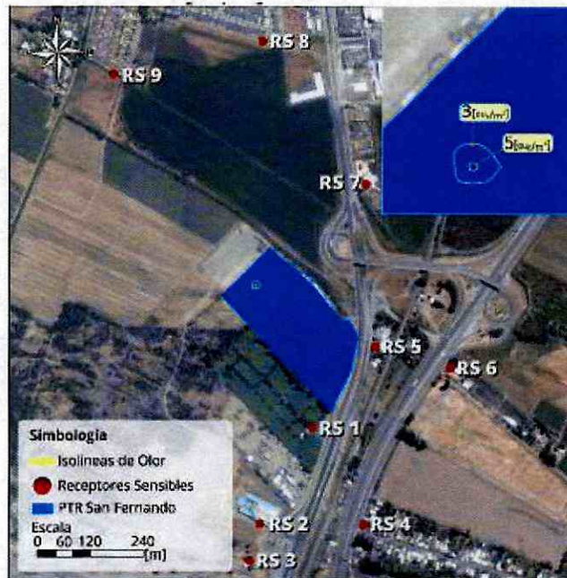
Imagen N° 5: Alcance odorante de planta de tratamiento implementada en escenario "actual"