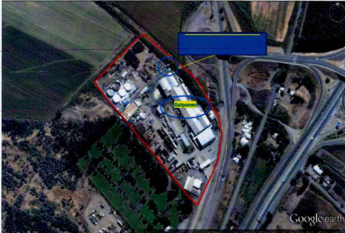
Imagen N° 2: Layout del proyecto