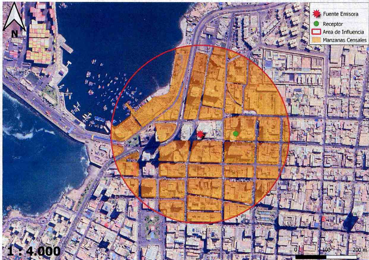
Imagen 1. Intersección manzanas censales y AI