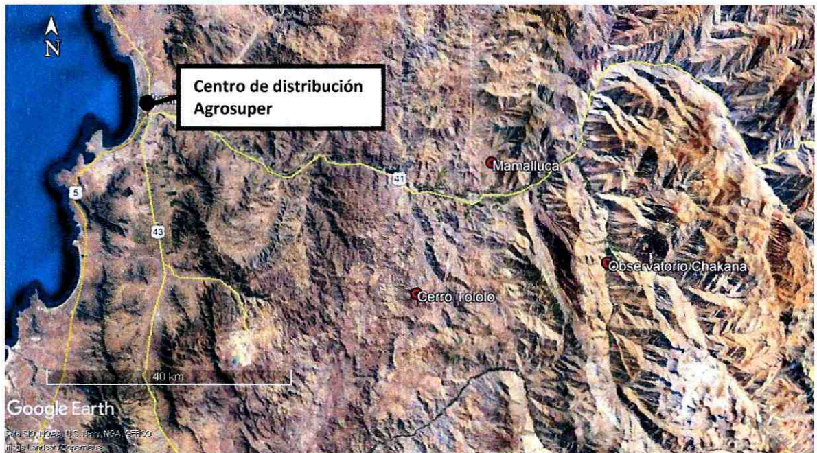
Imagen N°1. Ubicación geográfica de CDA y observatorios astronómicos