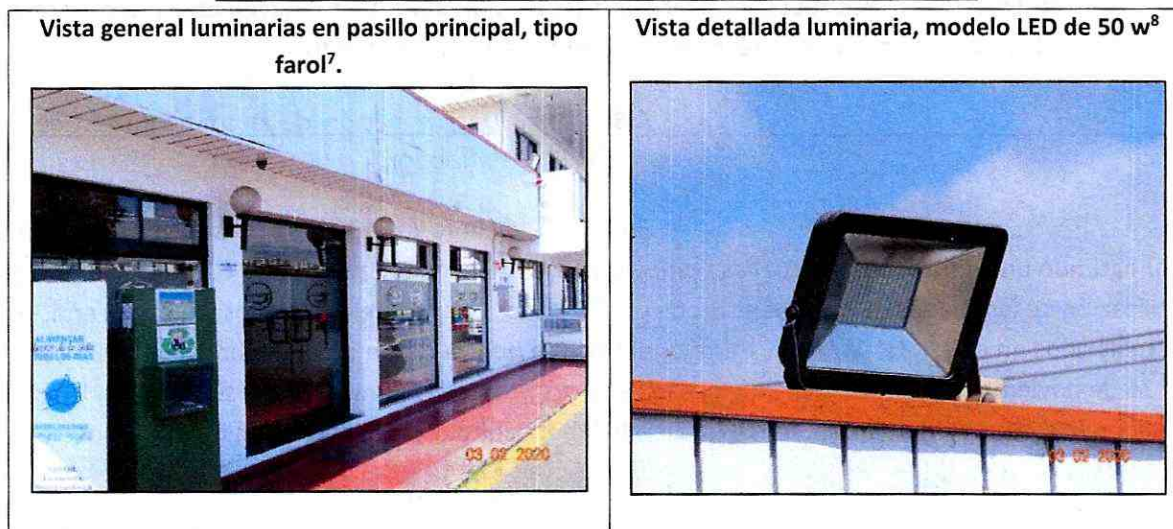
Ilustración 2, 3, 4 y 5. Vista de las luminarias instaladas en CDA

42° En cuanto a la prueba en que se sustenta este cargo, cabe indicar que en el acta de inspección ambiental levantada con fecha 3 de febrero de 2020 en la unidad fiscalizable, se señaló que “se observó que todas las luminarias se disponían de manera que propician la emisión de luz al hemisferio superior”. Los referidos hechos al haber sido constatados por personal de esta Superintendencia constituyen una presunción legal, según se dispone en el artículo 8 inciso segundo de la LOSMA 6 .