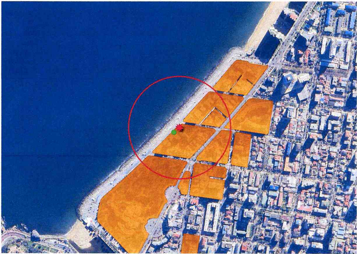
Imagen 2. Intersección manzanas censales y AI