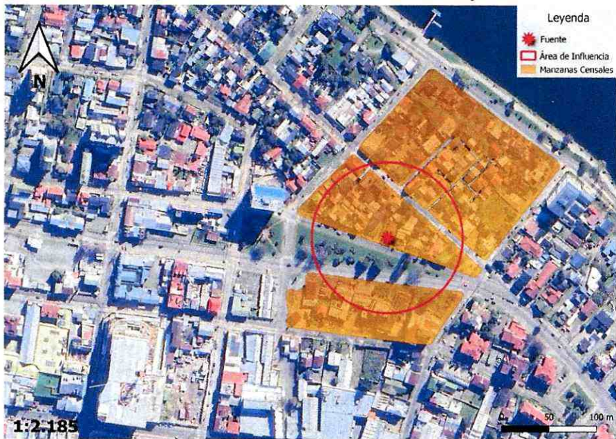
Imagen 2. Intersección manzanas censales y AI