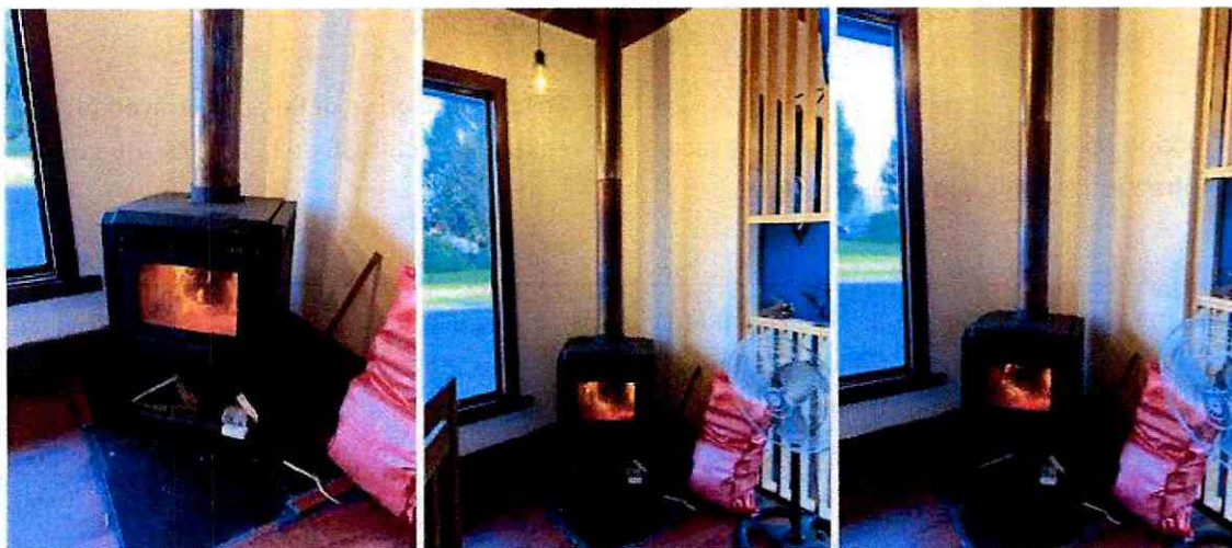
Imagen 1. Calefactor unitario a leña en Pizzería Pablito Vallejos.