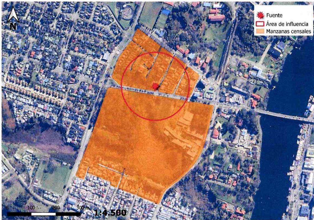
Figura 4. Intersección manzanas censales y AI