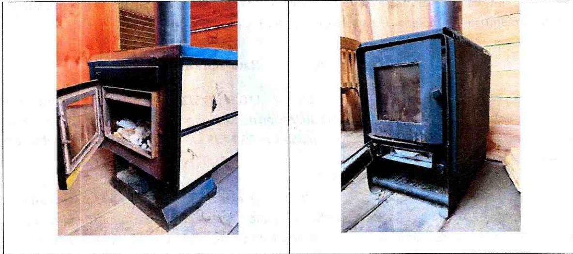
Imagen 1. Calefactores unitarios a leña en Bar La Cantera.