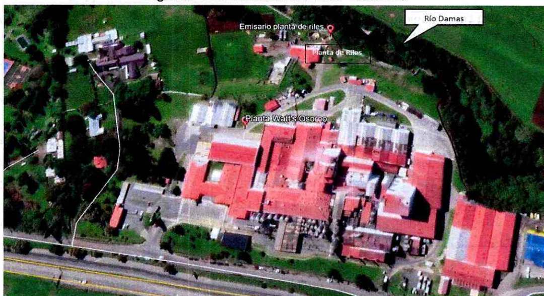
Figura N° 1: Ubicación de la unidad fiscalizable

2° El titular opera una planta cuyo objeto es el tratamiento de residuos industriales líquidos (en adelante, "RILes") provenientes de sus procesos de producción de queso, leche en polvo y suero. Culinado el proceso productivo, los RILes pasan por un sistema de tratamiento biológico para ser descargados al río Damas. Adicionalmente, la empresa cuenta con autorización para verter 1000 m 3 /día de RILes al sistema de alcantarillado de ESSAL. Esta planta constituye una unidad fiscalizable denominada para estos efectos "Watt's Osorno", la cual se emplaza en calle Longitudinal Sur S/N, comuna de Osorno, Región de Los Lagos. A continuación, se ilustra la ubicación de la unidad fiscalizable: