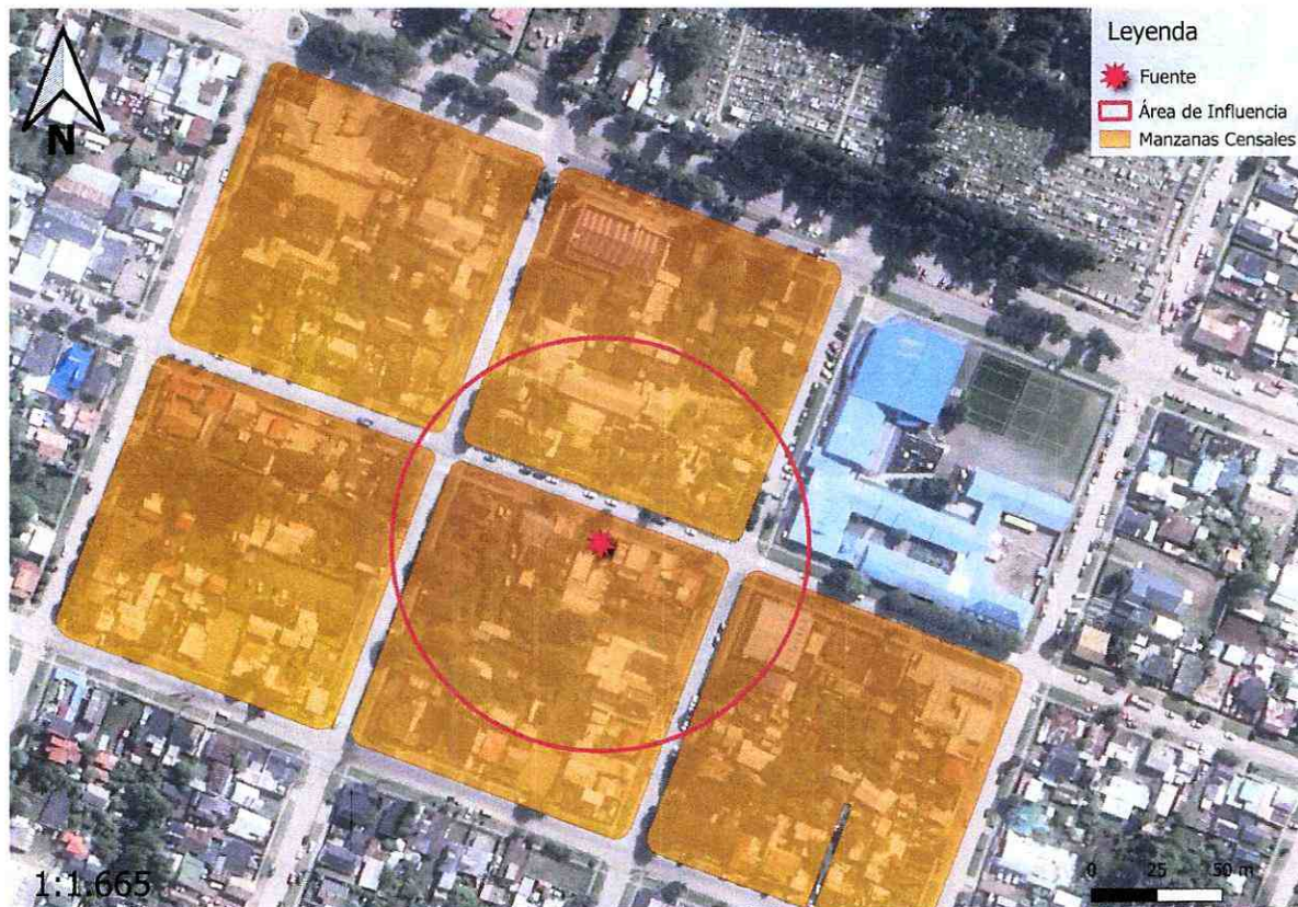
Imagen 4. Intersección manzanas censales y AI