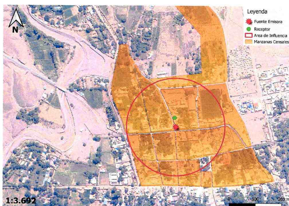
Imagen 1. Intersección manzanas censales y AI