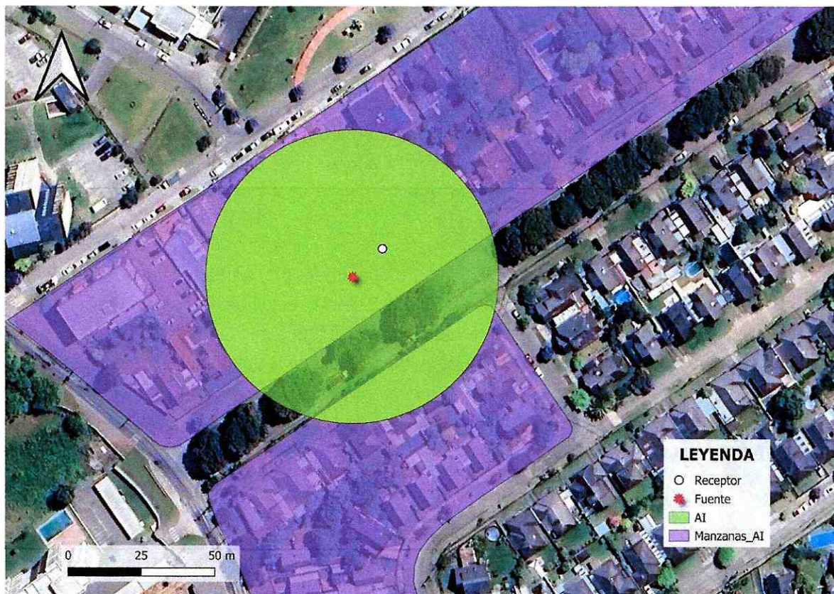
Imagen 1. Intersección manzanas censales y AI