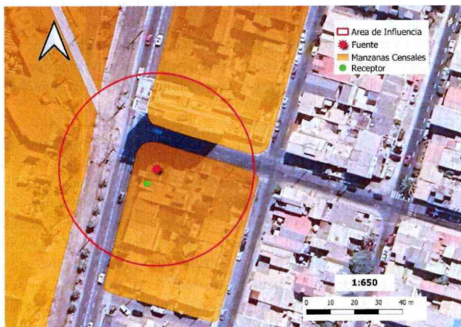
Imagen 1. Intersección manzanas censales y AI