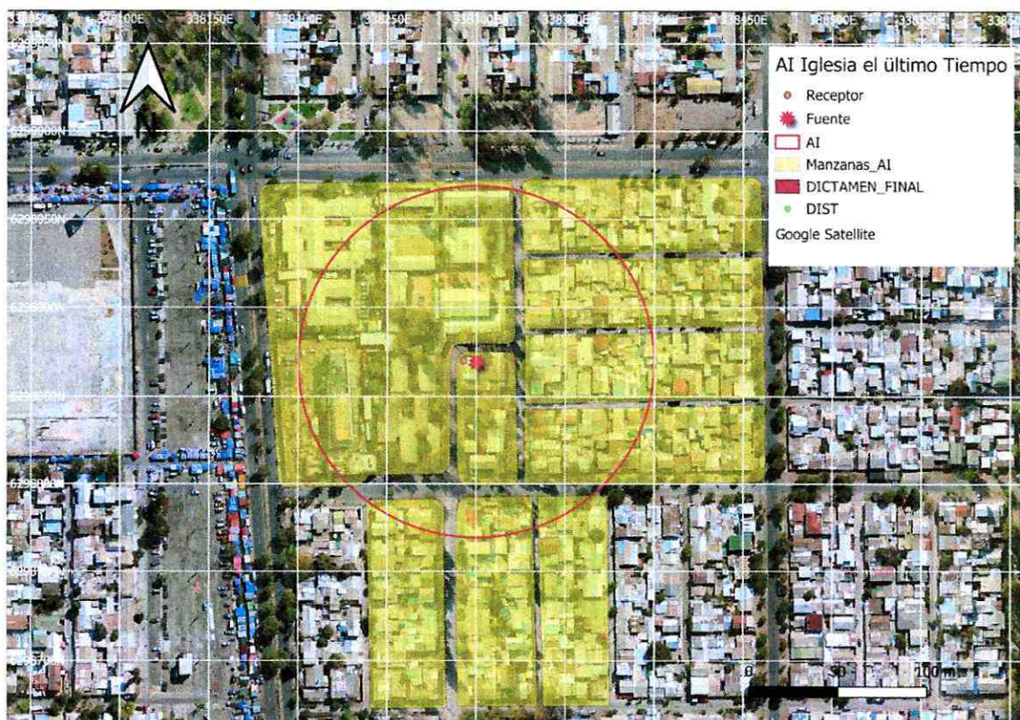
Imagen 1. Intersección manzanas censales y AI