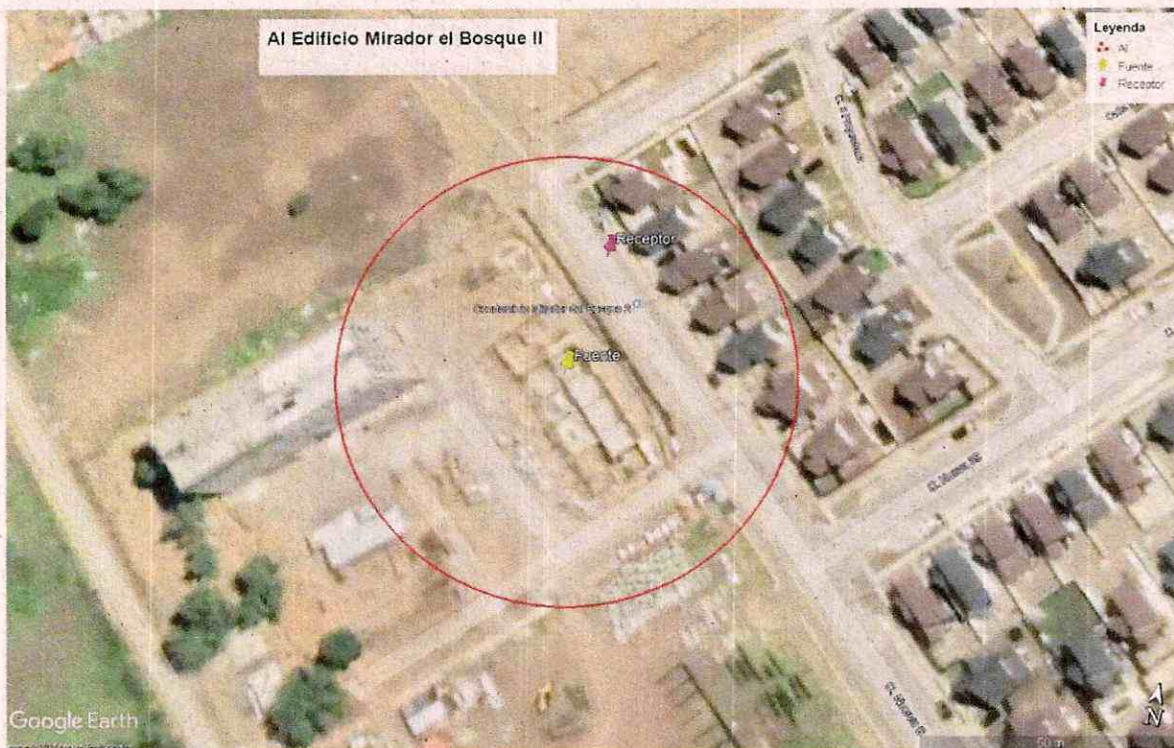
Imagen 1. Intersección manzanas censales y AI