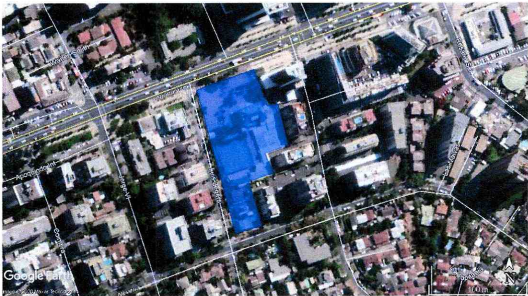
Imagen 1. Ubicación del proyecto Urbana Center Apoquindo