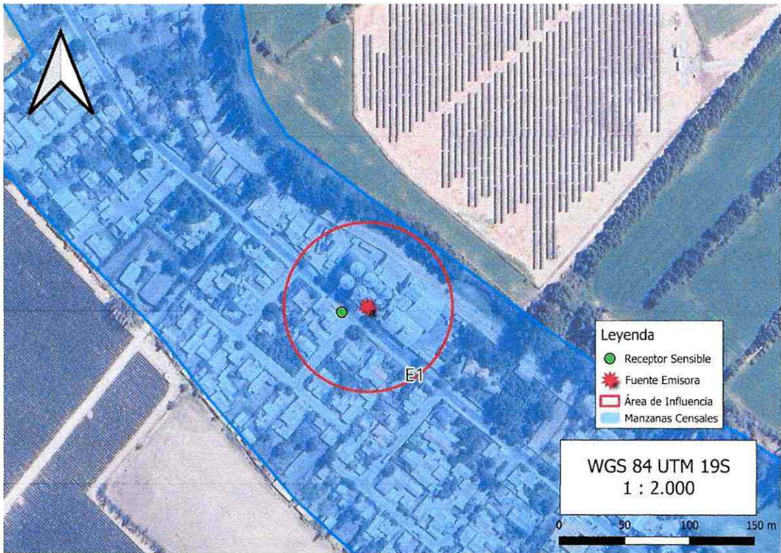
Imagen 1. Intersección manzanas censales y AI