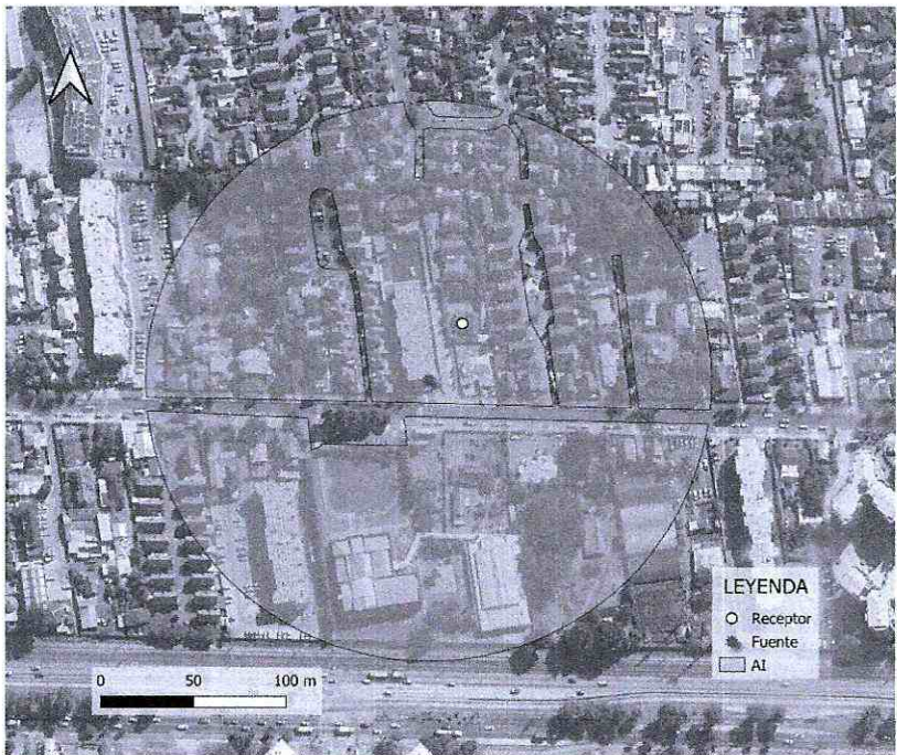
Imagen 1. Intersección manzanas censales y AI