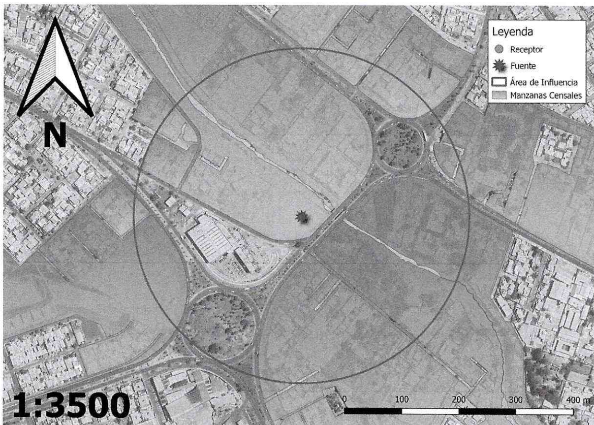
Imagen 1. Intersección manzanas censales y AI