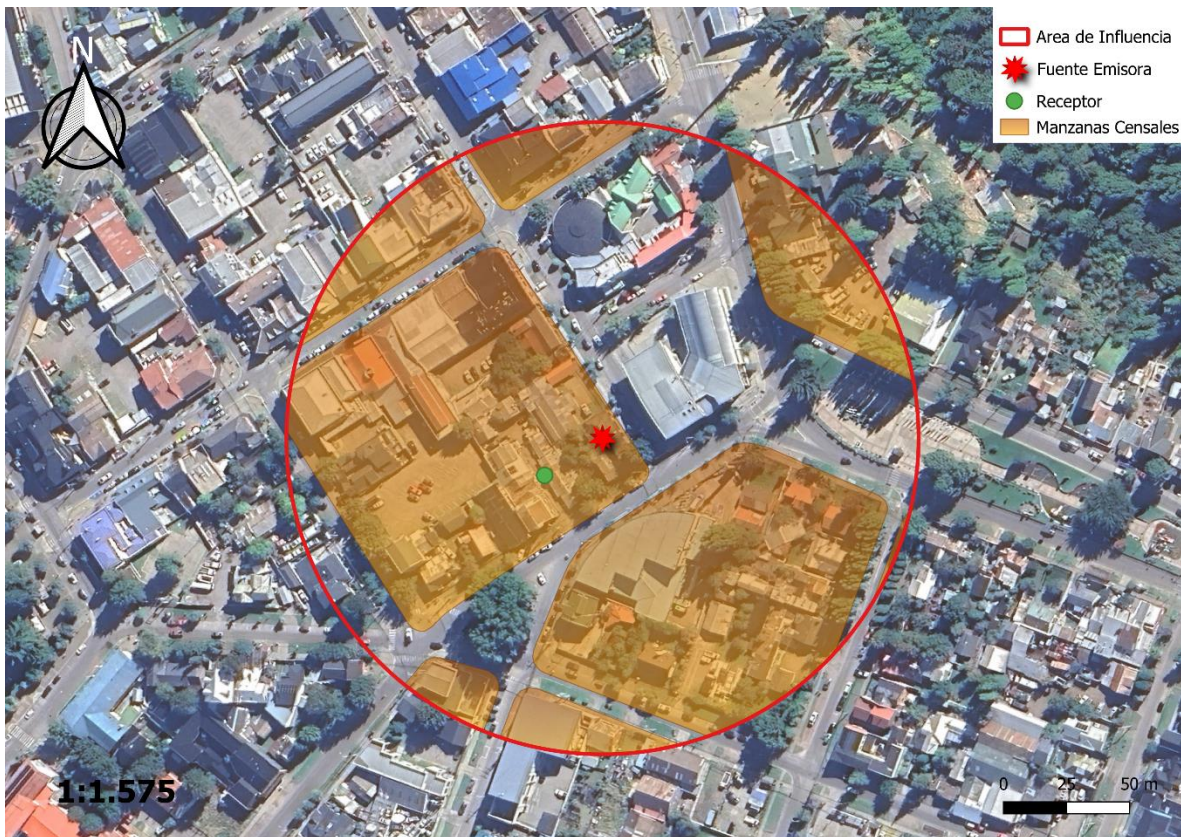
Imagen 1. Intersección manzanas censales y AI