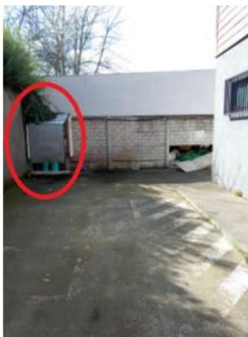
Antes de diciembre 2020