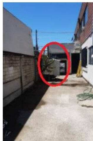
Después de diciembre 2020

Fuente: Anexo 6 del Programa de Cumplimiento de fecha 15 de marzo de 2022.