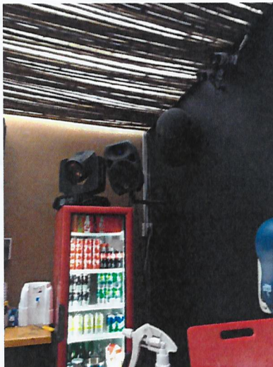
Fotografía N° 3

Fuente: SMA. Informe de Fiscalización Informe DFZ-2018-836-II-PC-IA. Fecha del registro corresponde al 10 de agosto de 2018. Parlante operativo "Warfedale", cerca de la barra del 2° piso, Pub Noa.