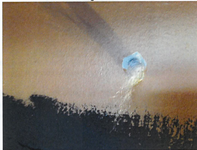
Fotografía N° 7

Fuente: SMA. Informe de Fiscalización Informe DFZ-2018-836-II-PC-IA. Fecha del registro corresponde al 10 de agosto de 2018. Lana mineral inserta dentro de los paneles acústicos construidos sobre el muro existente.