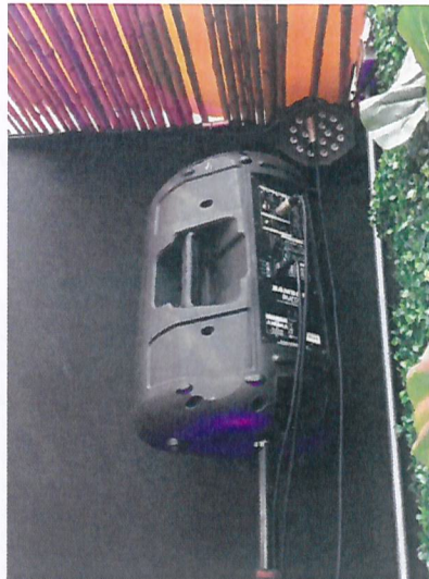
Fotografía N° 4

Fecha del registro corresponde al 10 de agosto de 2018. Parlante operativo "Samsung", sector "DJ" del 2° piso, Pub Noa.