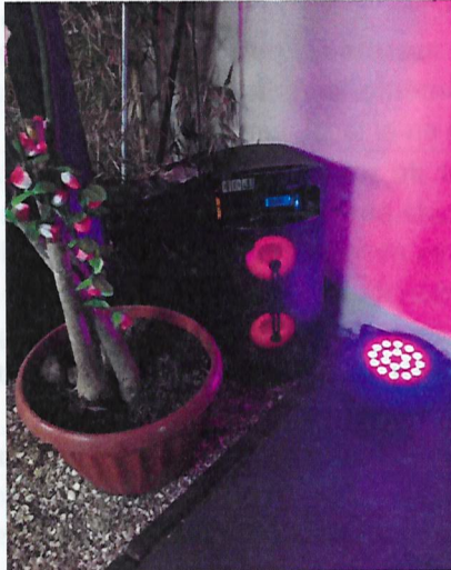
Fotografía N° 1

Fuente: SMA. Informe de Fiscalización Informe DFZ-2018-836-II-PC-IA. Fecha del registro corresponde al 10 de agosto de 2018. Parlante operativo en primer piso de Pub Noa.