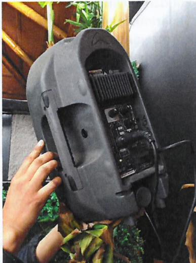
Fotografía N° 2

Fecha del registro corresponde al 10 de agosto de 2018. Parlante operativo "Warfedale", en terraza del 2° piso, Pub Noa.