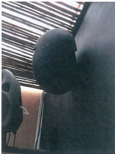
Fotografía N° 5

Fuente: SMA. Informe de Fiscalización Informe DFZ-2018-836-II-PC-IA. Fecha del registro corresponde al 10 de agosto de 2018. Parlante "Electrovoice Evid 6.2", sin conexión, cerca de la barra del 2° piso, Pub Noa.