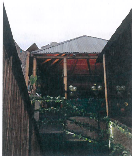
Fotografía N° 8

Fuente: SMA. Informe de Fiscalización Informe DFZ-2018-836-II-PC-IA. Fecha del registro corresponde al 10 de agosto de 2018. Techo sobre terraza trasera.