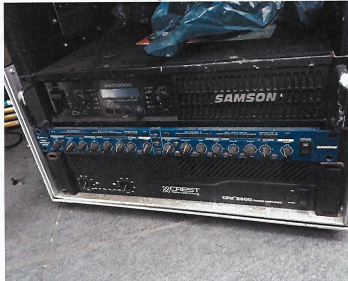
Fotografía N° 10

Fuente: SMA. Informe de Fiscalización Informe DFZ-2018-836-II-PC-IA. Fecha del registro corresponde al 10 de agosto de 2018. Limitador sin uso.