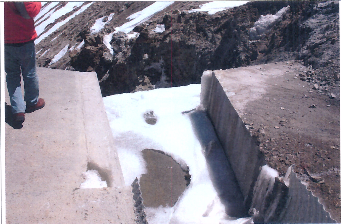
Foto N°3, Obra de Arte ubicada al final del Canal Perimetral Norte Superior, salida de agua.