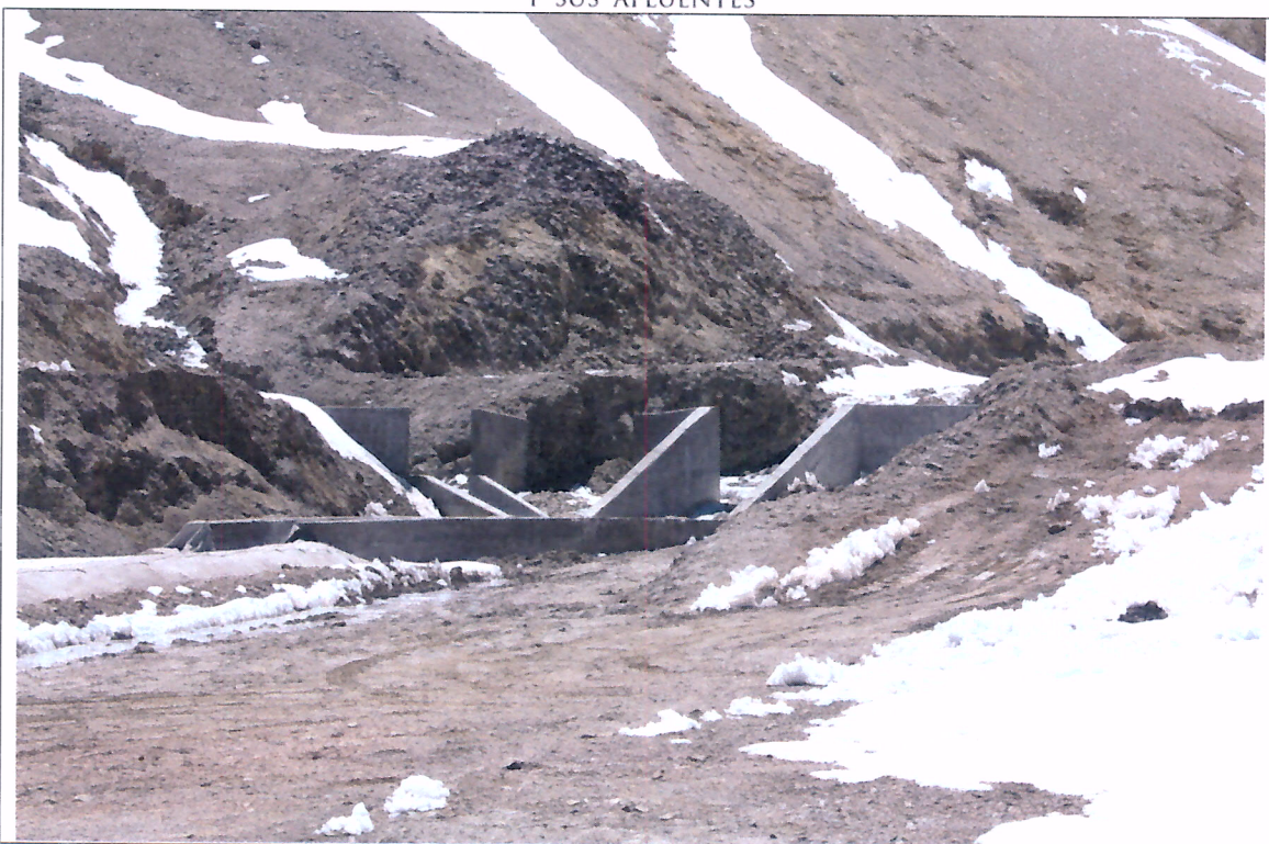
Foto N°2, Obra de Arte ubicada al inicio en Canal Perimetral Norte Superior