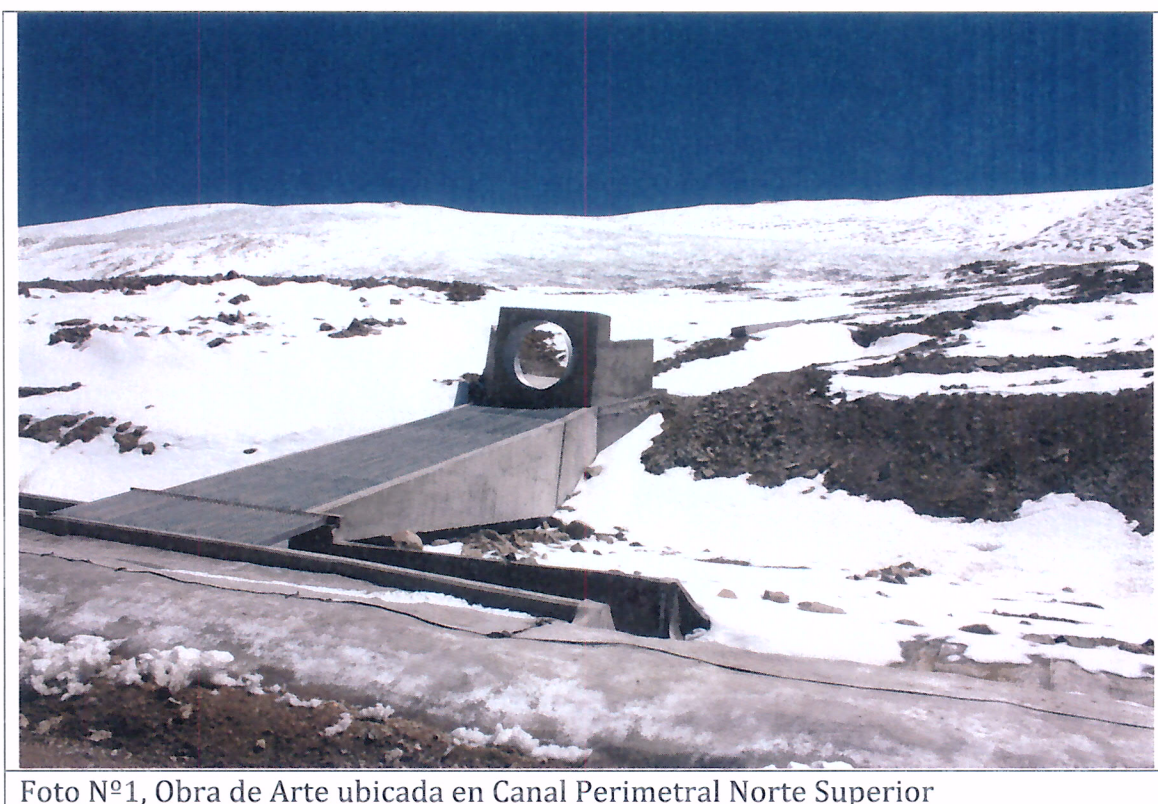
Foto N°1, Obra de Arte ubicada en Canal Perimetral Norte Superior