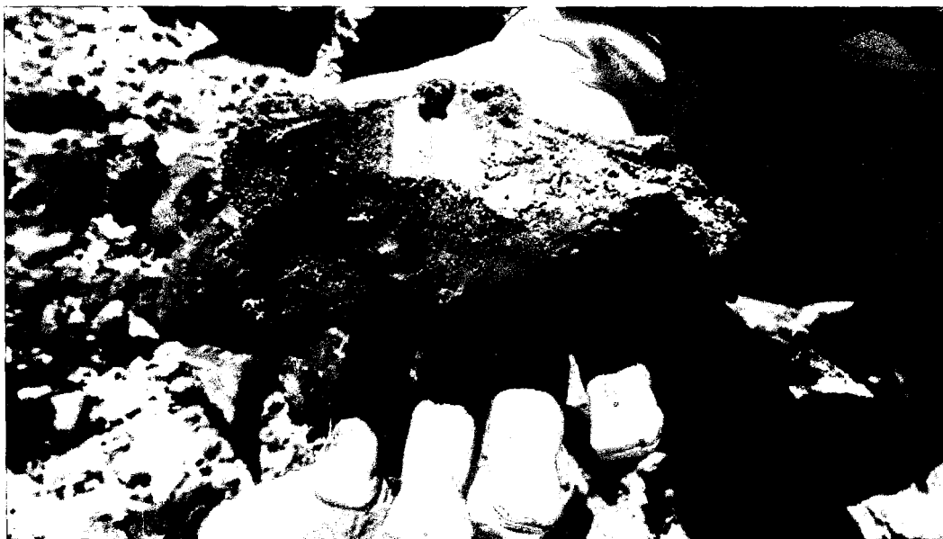
Figura 6. Detalle de Material con hidrocarburo encontrado en el área.