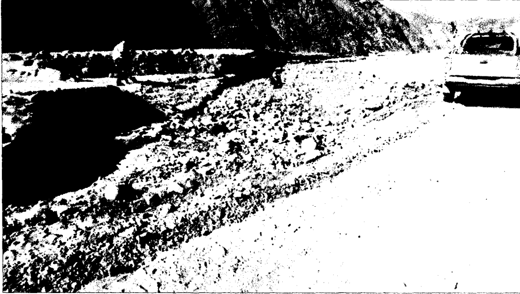
Figura 2. Ubicación del Punto Contaminado en relación al camino, inmediatamente adyacente.