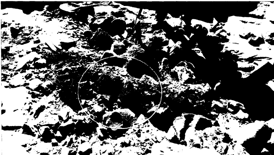
Figura 5. Calicata realizada previo retiro de piedras y rocas superficiales, mostrando tierra con hidrocarburos (rojo).