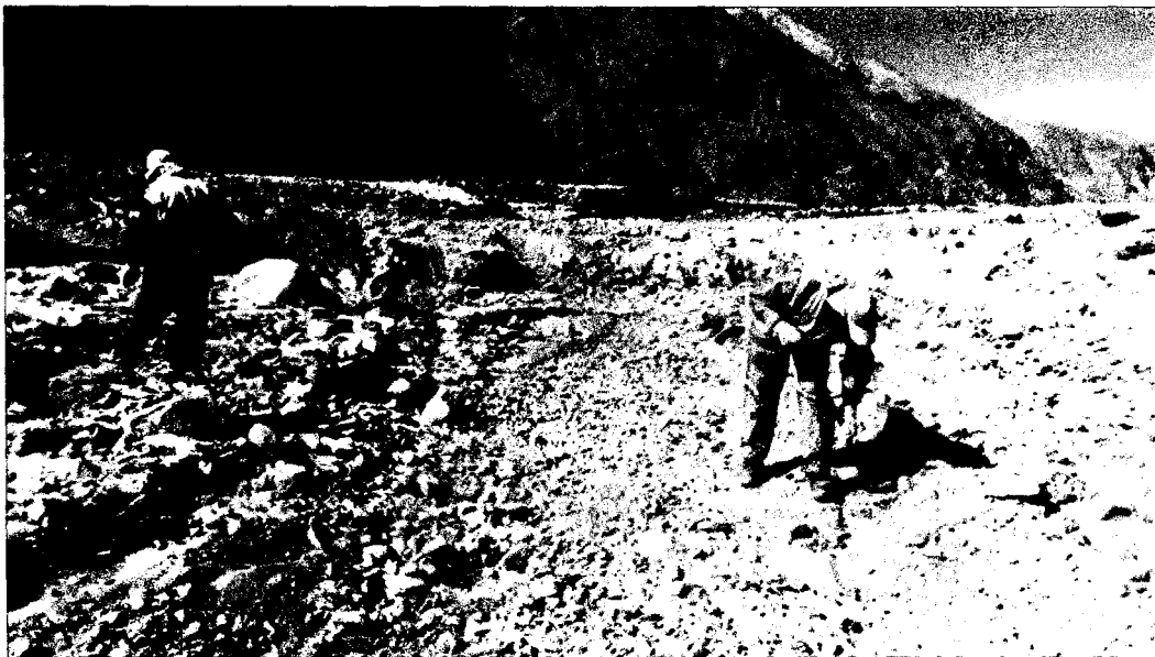
Figura 3. Inspección del área con sospecha de contaminación, al Sur Oeste del Camino.