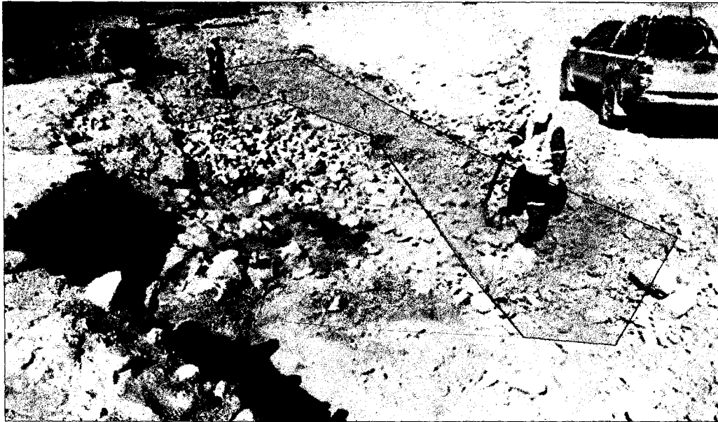
Figura 4. Vista del Área completa, mostrando posible zona contaminada con hidrocarburos (rojo) y zona aparentemente Limpia (verde).