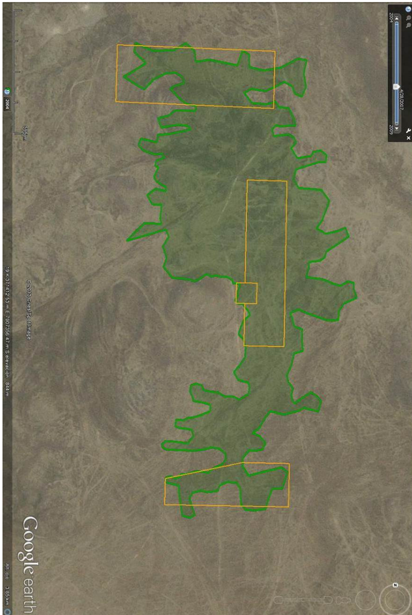
Figura 1: Imagen satelital con las áreas de protección y resguardo (polígonos color naranja) tal cual fueron planteadas originalmente en la Resolución de Calificación Ambiental y su relación con el yacimiento arqueológico Salamanqueja 12-13 (polígono color verde),