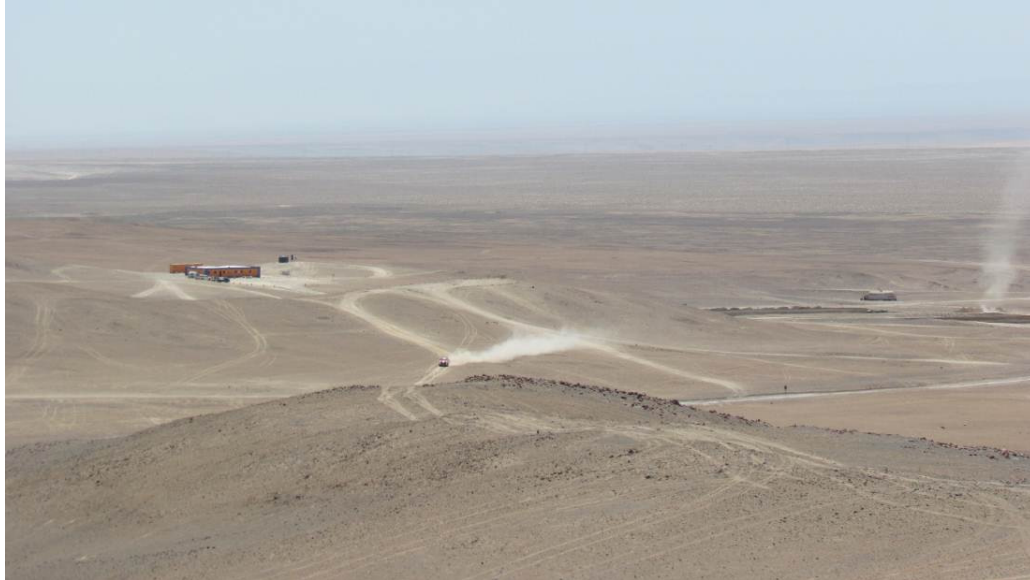
Figura 6: Vista general de presencia de huellas y paso de vehículos en el interior del yacimiento arqueológico Salamanqueja 12-13 (19 de Marzo del 2013).