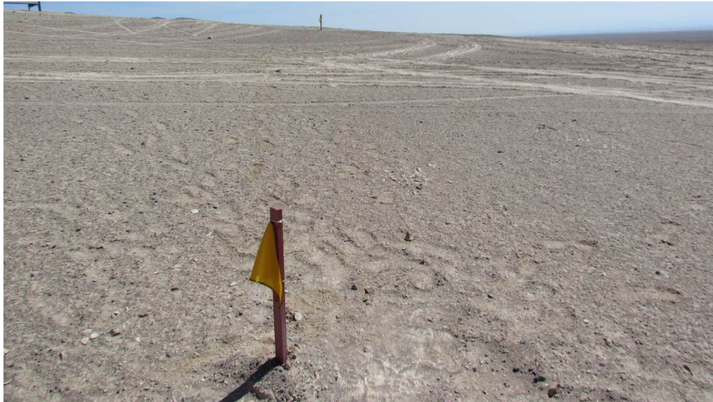
Figura 2: Detalle de estacas bajas con banderines amarillos para delimitar polígono de protección (19 Marzo 2013).