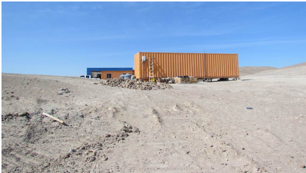
Figura 3: Instalaciones en el área administrativa emplazadas en el interior de la definición original del Polígono de protección Norte (19 Marzo 2013).