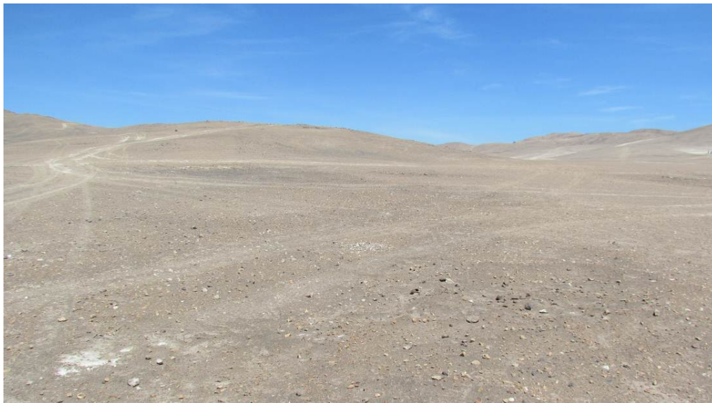
Figura 7: Vista de huellas vehiculares en el interior del yacimiento arqueológico Salamanqueja 12-13 (19 de Marzo del 2013).