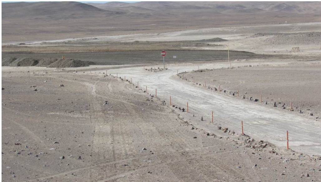
Figura 5: Vista de caminos demarcados en el acceso al área administrativa (19 Marzo del 2013).