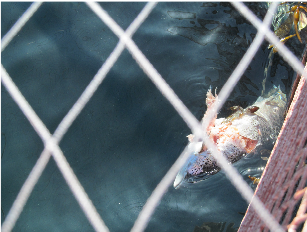
Figura 2. Extracción de mortalidad deficiente.