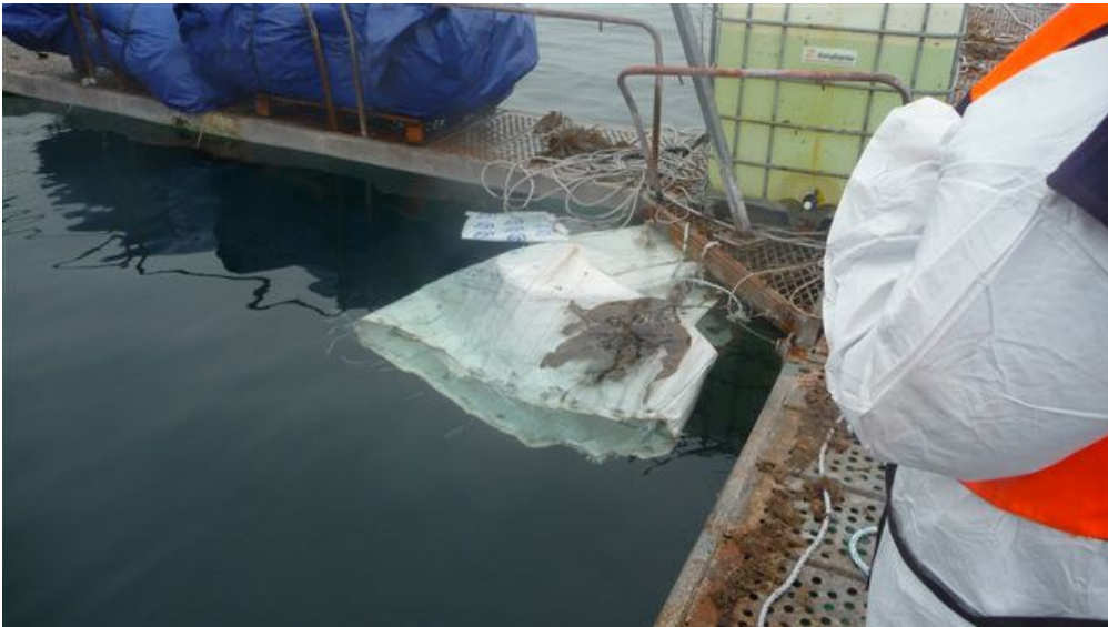
Figura 7. Maxisaco sujeto al modulo con un corte en la base de este, el cual fue encontrado en una segunda visita al centro el 14-04-2013.