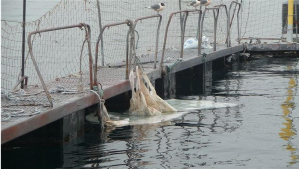
Figura 6. Maxisacos sujetos a baranda del modulo, el cual fue encontrado en una segunda visita al centro el 14-04-2013.