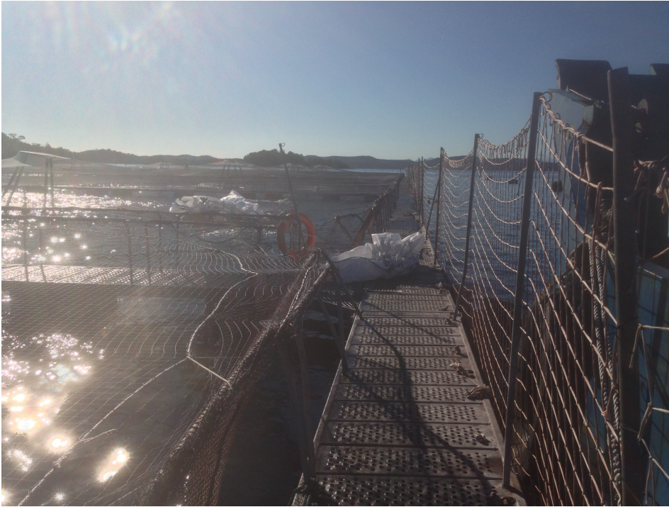
Figura 4. Maxisacos dispuestos en el modulo para la extracción de mortalidad.