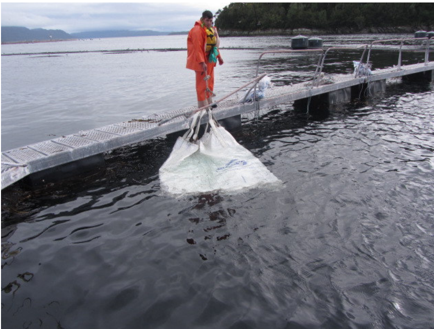
Figura 5. Maxisaco sujeto a baranda del modulo, el cual fue encontrado en una segunda visita al centro el 14-04-2013.