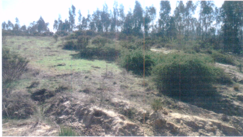
Fotografía N° 2