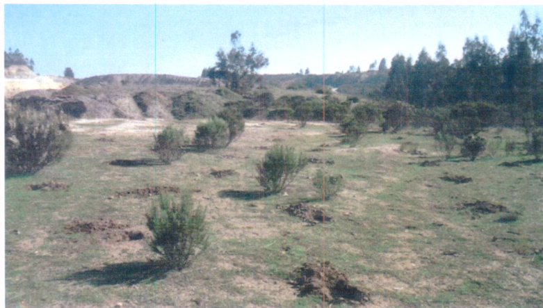
Fotografía N° 3