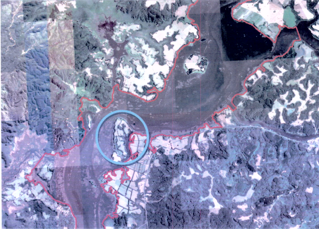
Figura N° 1