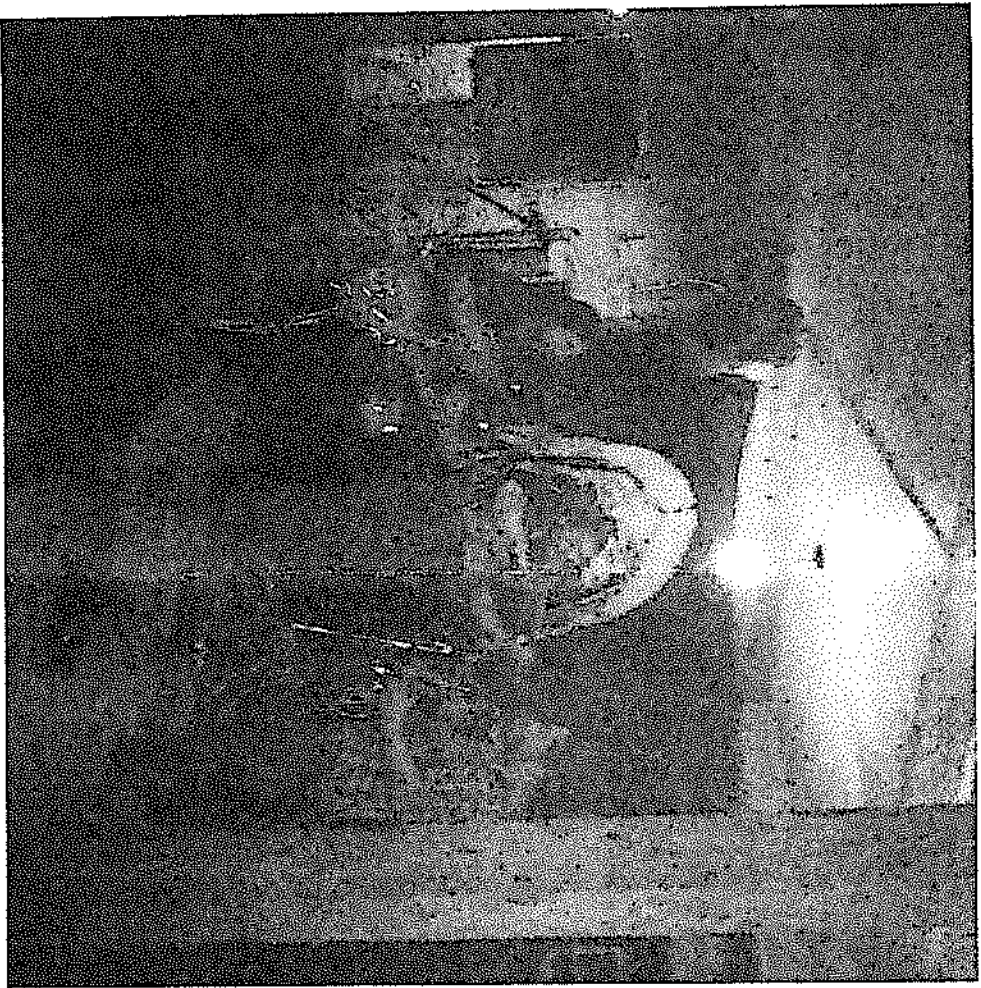
Fotografía de la fotocata al interior del local