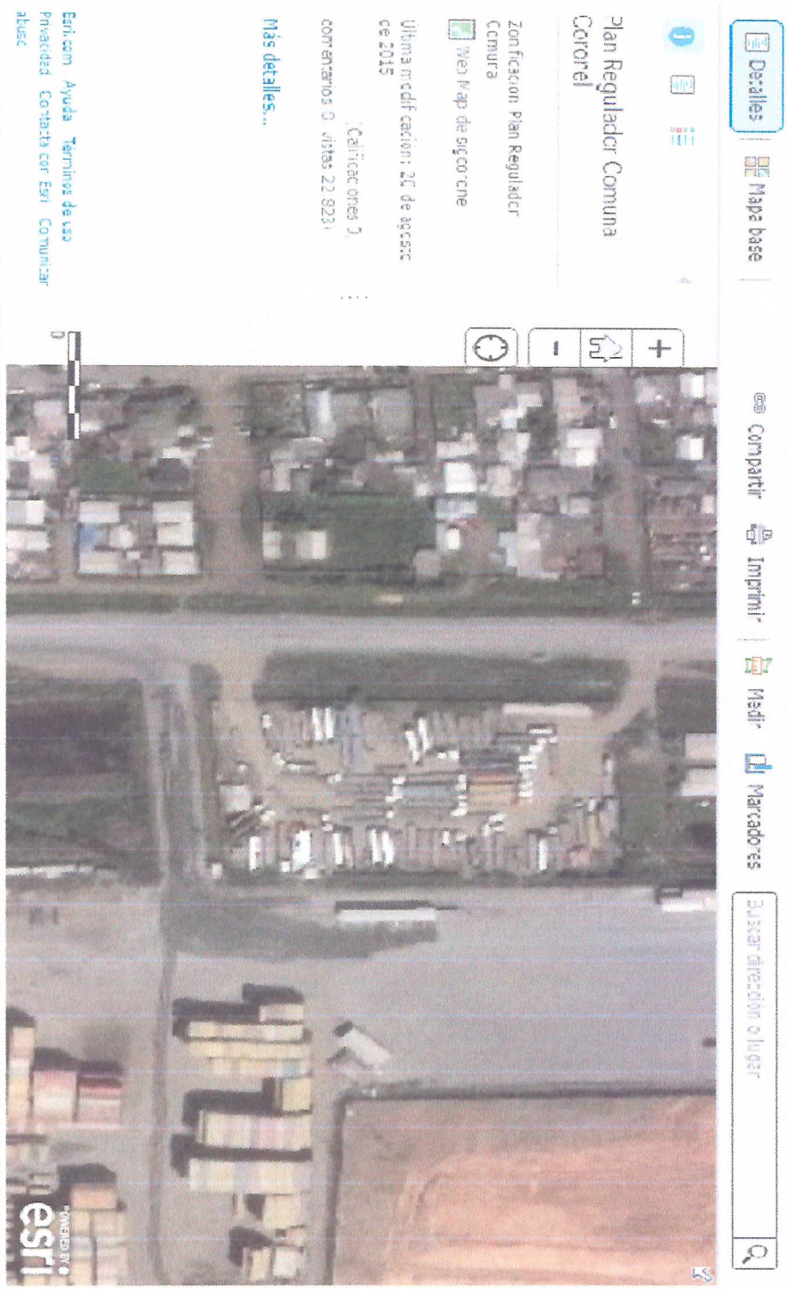
Imagen disponible en plan regulador I. Municipalidad de Coronel