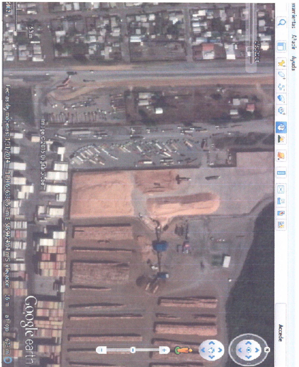
Imagen almacenada en archivo histórico del google earth de fecha 31 e3 Enero 2014