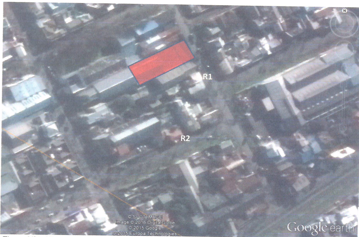
Figura N°1: Ubicación geográfica de la discoteca Palo Santo.

Los posibles receptores se ubican al costado de la discoteca, en la calle Caupolicán (R1), con coordenadas UTM 673155.24 m E, 5923850.20 m S, y en la calle Argentina (R2), con coordenadas UTM 673145.50 m E, 5923798.92 m S.