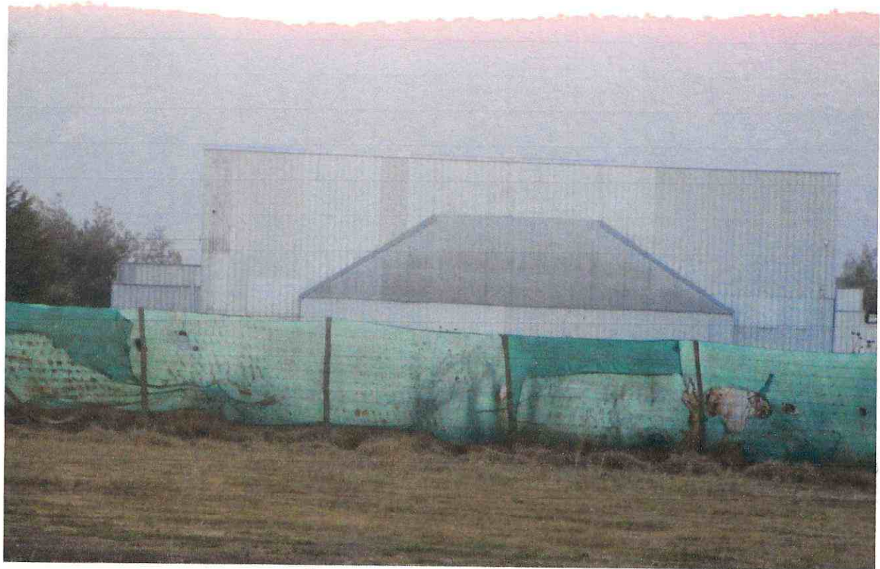
↑ EX - Boulevard ↑