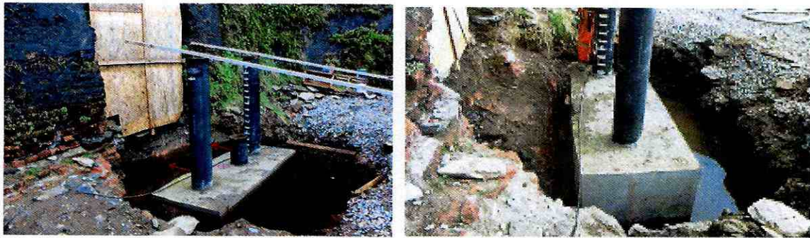
Imagen 3: Intervenciones para la instalación del dado de hormigón en las afueras del túnel de acceso al fuerte, se emplaza a una distancia aproximada de 50 cm respecto a la línea del muro.