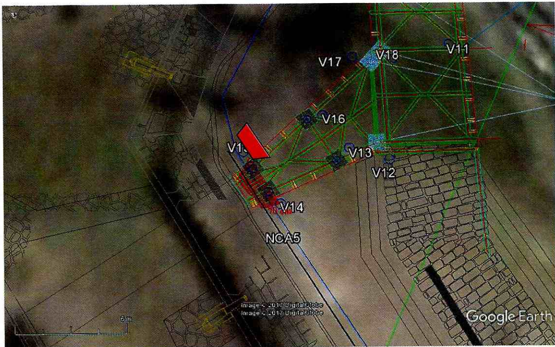
Imagen 5: polígono rojo grafica las intervenciones para la instalación del dado de hormigón en las afueras del túnel de acceso al fuerte. La línea negra grafica la proyección de los sondeos P1-2 y P3-4 (140 x 70 cm) ejecutados en el marco de la evaluación ambiental del proyecto donde se identificaron las fundaciones del muro cortina (ARKA 2010).

A esto cabe agregar que de acuerdo al análisis presentado en “Informe preliminar de caracterización arqueológica Playa la Argolla” que da cuenta de las labores arqueológicas desarrolladas entre los días 13 al 27 de febrero del 2017 (Ingreso CMN N° 2704 del 25.04.2017), se recomienda “la fijación de un buffer o franja de inclusión de 1m de ancho en torno a la cortina”, aspecto que tampoco fue considerado para la ejecución de estas labores.