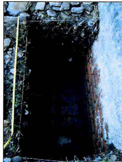
Imagen 2: Fundaciones del muro cortina identificadas a partir de los 100 y 110 cm respectivamente, en sondeos P1-2 y P3-4 (140 x 70 cm) ejecutados en el marco de la evaluación ambiental del proyecto (ARKA 2010).

En virtud de dichos resultados, durante el proceso de evaluación ambiental se estableció lo siguiente: