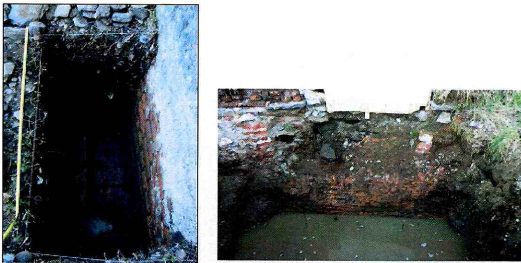
Imagen 4: a la izquierda fundaciones del muro cortina identificada en el marco de los sondeos de la línea de base a partir de los 100 cm de profundidad; a la derecha muro cortina expuesto por las excavaciones para la construcción del bloque de hormigón.