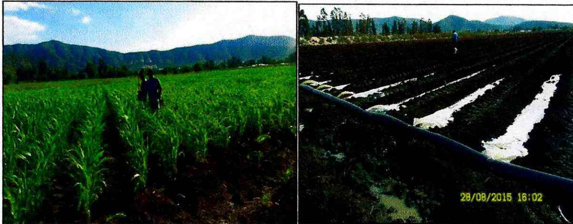
Imagen N°4: Personal de campo desarrollando funciones de riego.

Además, de un aumento en la dotación de trabajadores en un 50% para el control de fertirriego.