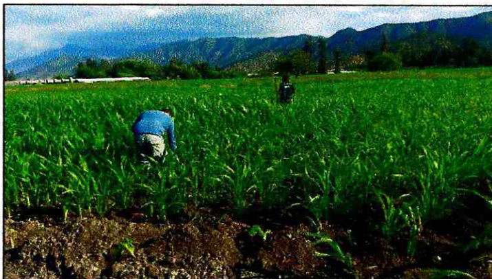
Imagen N°6: Terrenos fertirrigados.