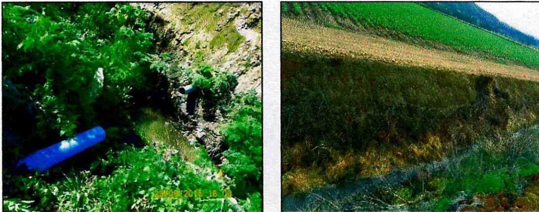
Imagen N°1: Retiro de ducto.

En forma de acción inmediata se subsanó este punto, haciendo uso de maquinaria y jornales para el retiro de la tubería. Esto se puede evidenciar con dos fotografías adjuntas, en donde se ve el talud del canal de drenaje con la tubería (con fecha de agosto del 2015) y como se encuentra en la actualidad luego de haberla sacado en forma inmediata.