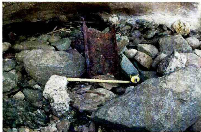
Figura 3: Rasgo NCA-2

En cuanto al Rasgo NCA-2 (Figura 3), tal como se expresó en párrafos anteriores, coincide con los materiales constructivos empleados por la industria siderúrgica que existió en el lugar durante el S. XX, por lo que es factible suponer su correspondencia a este periodo de ocupación del Monumento Histórico, mientras que el Rasgo NCA-3 (Figura 4), dado lo acotado de su registro y el amplio espectro de uso de ladrillos en el continuo ocupacional del fuerte, no es factible establecer alguna relación temporal.