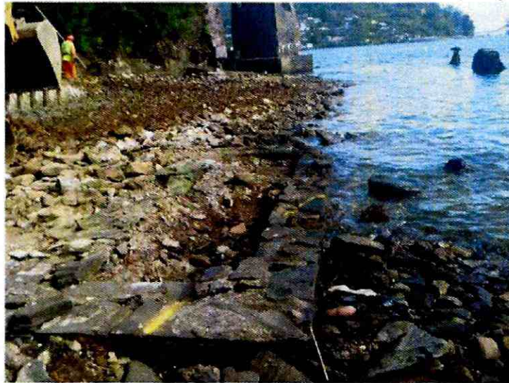
Figura 2: Rasgo Estructural NCA-1.

En cuanto al Rasgo NCA-2 (Figura 3), tal como se expresó en párrafos anteriores, coincide con los materiales constructivos empleados por la industria siderúrgica que existió en el lugar durante el S. XX, por lo que es factible suponer su correspondencia a este periodo de ocupación del Monumento Histórico, mientras que el Rasgo NCA-3 (Figura 4), dado lo acotado de su registro y el amplio espectro de uso de ladrillos en el continuo ocupacional del fuerte, no es factible establecer alguna relación temporal.