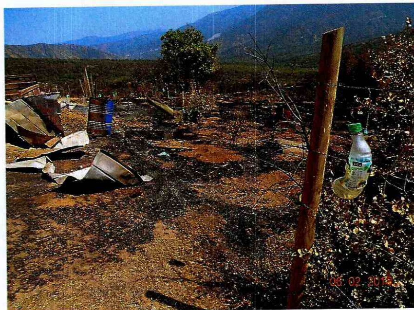
Ilustración 2 Cerco dañado