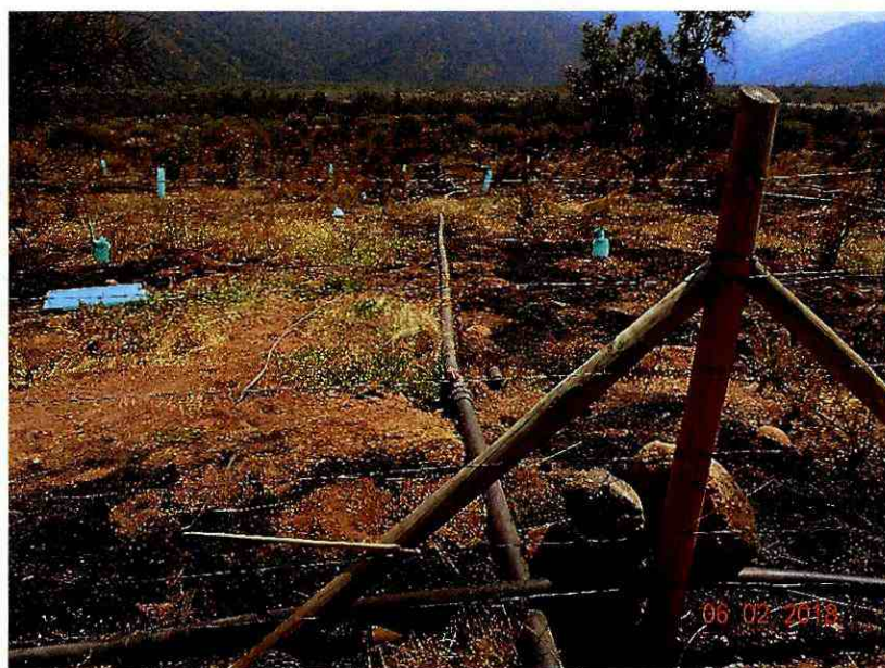
Ilustración 5 Shelters dañados