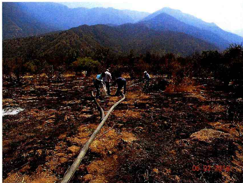
Ilustración 4 Reparación de matriz de riego