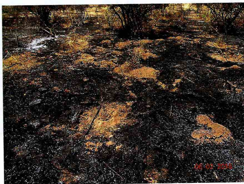
Ilustración 3 Sistema de riego dañado