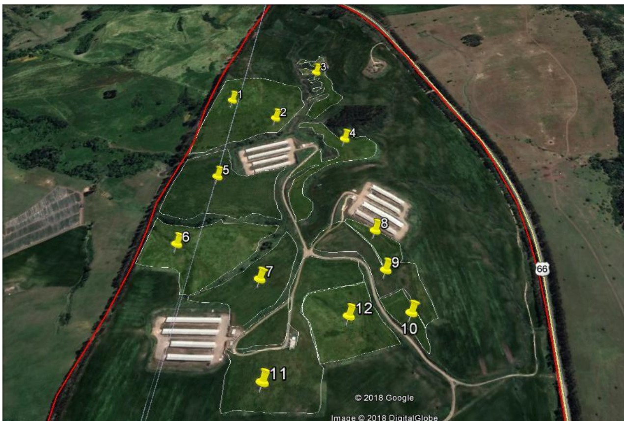
Figura 2: Parcelas de Muestreo PMF 2010