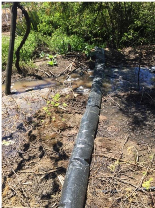
Imagen N° 1: Tubo que conduce RILes de la empresa infractora, para ser descargados irregularmente en el cerro contiguo a mi vivienda y al canal Pulmodón.

A continuación, se insertan fotografías capturadas con fecha 12 de diciembre de 2018, que dan cuenta del vertimiento irregular de RILes, por parte de la empresa RR Wines Limitada, en infracción a su RCA 373/2006, generando riesgos para el medio ambiente, mi vida e integridad física y psíquica, en tanto ha contaminado cursos de agua y napas subterráneas, incluyendo mis fuentes de abastecimiento de agua.