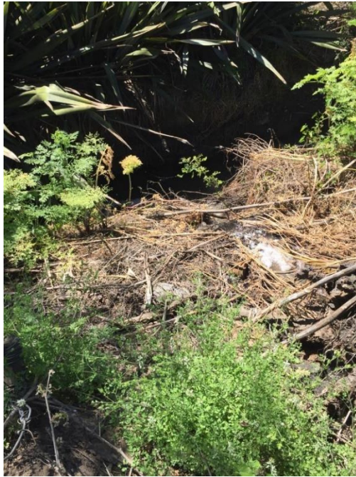
Imagen N° 4: Fosa por donde transitan RILes de la empresa infractora, para ser descargados irregularmente en el cerro contiguo a mi vivienda y al canal Pulmodón.