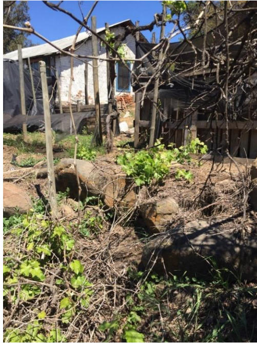
Imagen N° 6: Fotografía que muestra la casa habitación del cuidador de maquinaria pesada de la empresa infractora. En la porción inferior se observa tubo mediante el cual se descargan directamente aguas servidas al canal Pumodón.