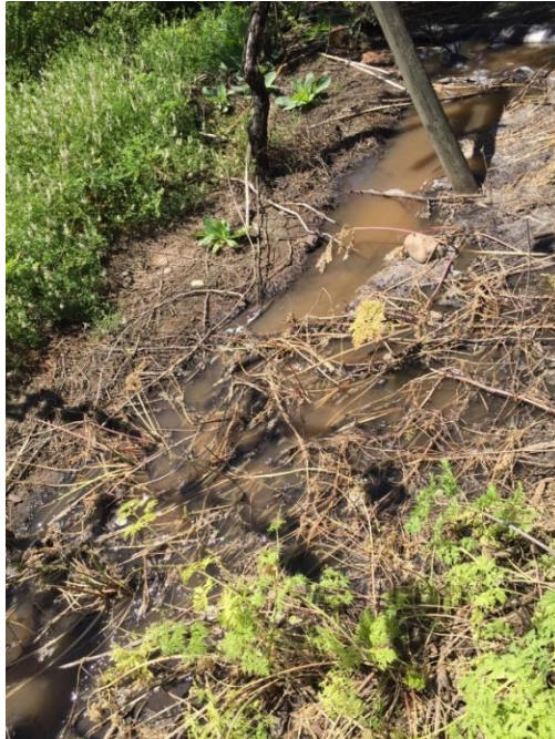
Imagen N° 3: Apozamientos de agua contiguos a tubo que conduce RILes de la empresa infractora, para ser descargados irregularmente en el cerro contiguo a mi vivienda y al canal Pulmodón.