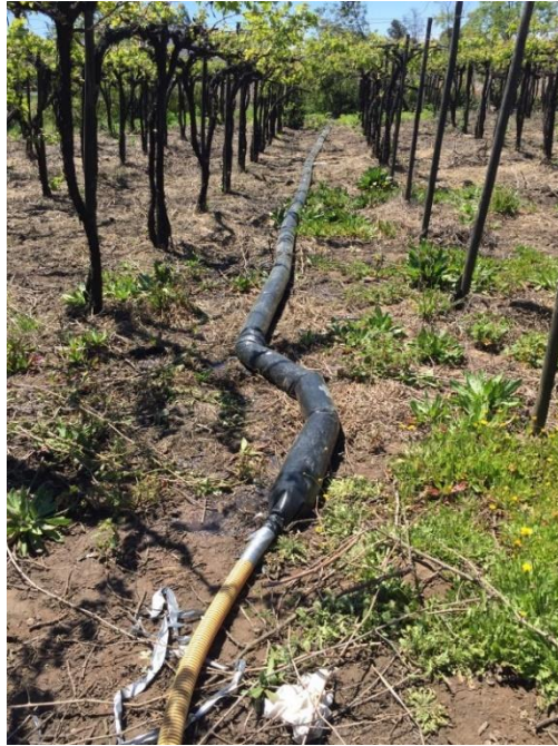
Imagen N° 2: Tubo que conduce RILes de la empresa infractora, para ser descargados irregularmente en el cerro contiguo a mi vivienda y al canal Pulmodón.