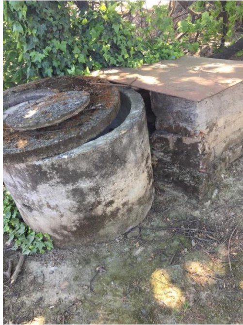
Imagen N° 8: Pozo contiguo a mi vivienda, construido originalmente con el objeto de abastecerme de agua, no obstante, actualmente se encuentra en desuso, dada la contaminación de las napas subterráneas como consecuencia del vertimiento irregular de RILes realizado por la empresa acusada.