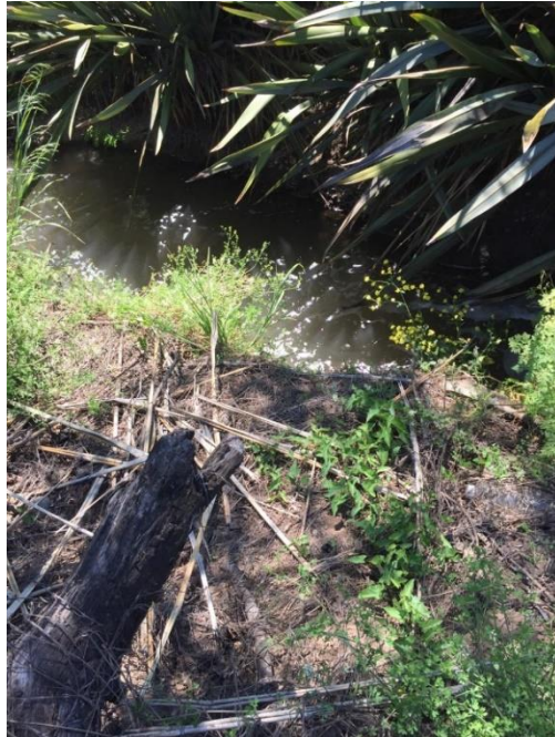
Imagen N° 5: Fosa por donde transitan RILes de la empresa infractora, para ser descargados irregularmente en el cerro contiguo a mi vivienda y al canal Pulmodón.