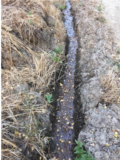
Imagen N° 7: Fotografía de la zanja que construí, con el objeto de que los RILes irregularmente vertidos por la empresa RR Wines Limitada, no penetraran en mi bodega de guarda, ni inunden el camino de acceso a mi vivienda.