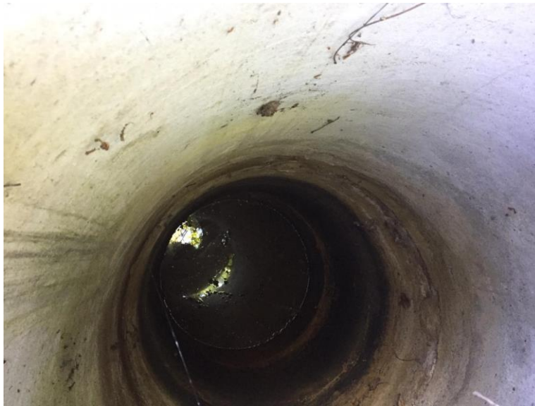
Imagen N° 9: Pozo contiguo a mi vivienda, construido originalmente con el objeto de abastecerme de agua, no obstante, actualmente se encuentra en desuso, dada la contaminación de las napas subterráneas como consecuencia del vertimiento irregular de RILes realizado por la empresa acusada.