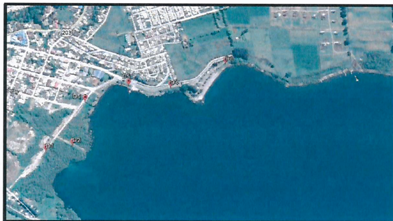
Imagen N° 1

Fuente: Anexo N° 1 de la presentación de ESSAL S.A. de fecha 07 de enero de 2019, Monitoreo Afluentes Bahía Lago Panguipulli de la ciudad de Panguipulli.