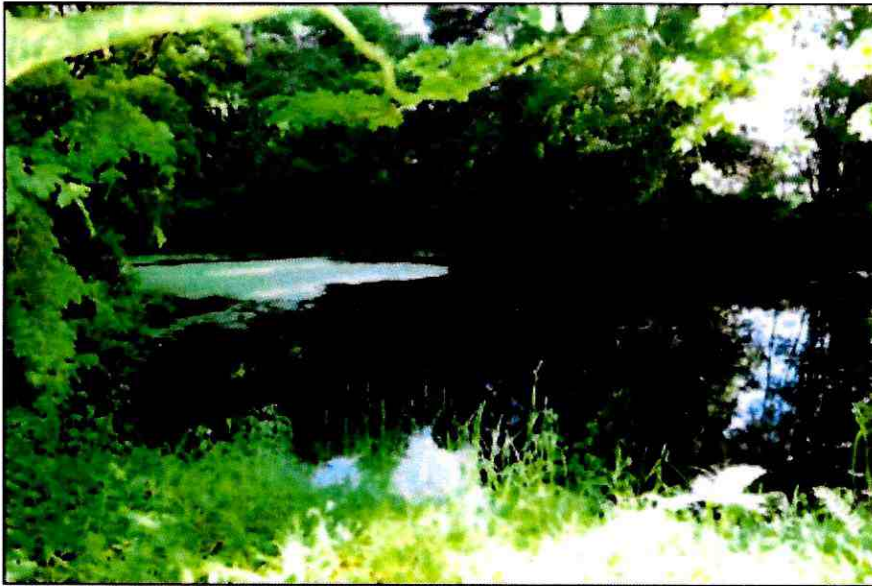
Fuente: Fotografía 29- Acta de inspección ambiental del tribunal, de fecha 3 de diciembre de 2018, expediente rol D-037-2018.