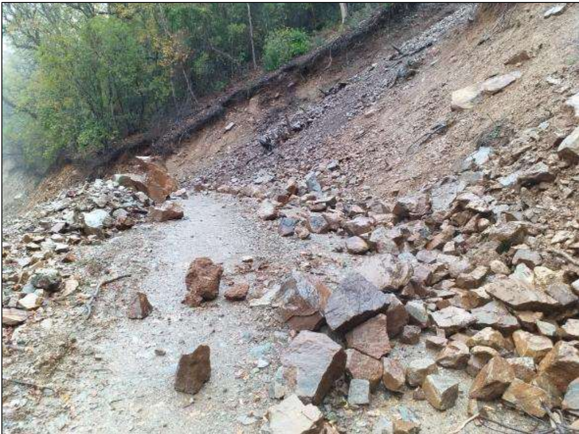
Fotografía 1. Material caído en sector derrumbe camino vecinal

La labor de limpieza finalizó a las 19.00 hrs. Debido a que ya no se contaba con luz natural para seguir desarrollando las actividades.