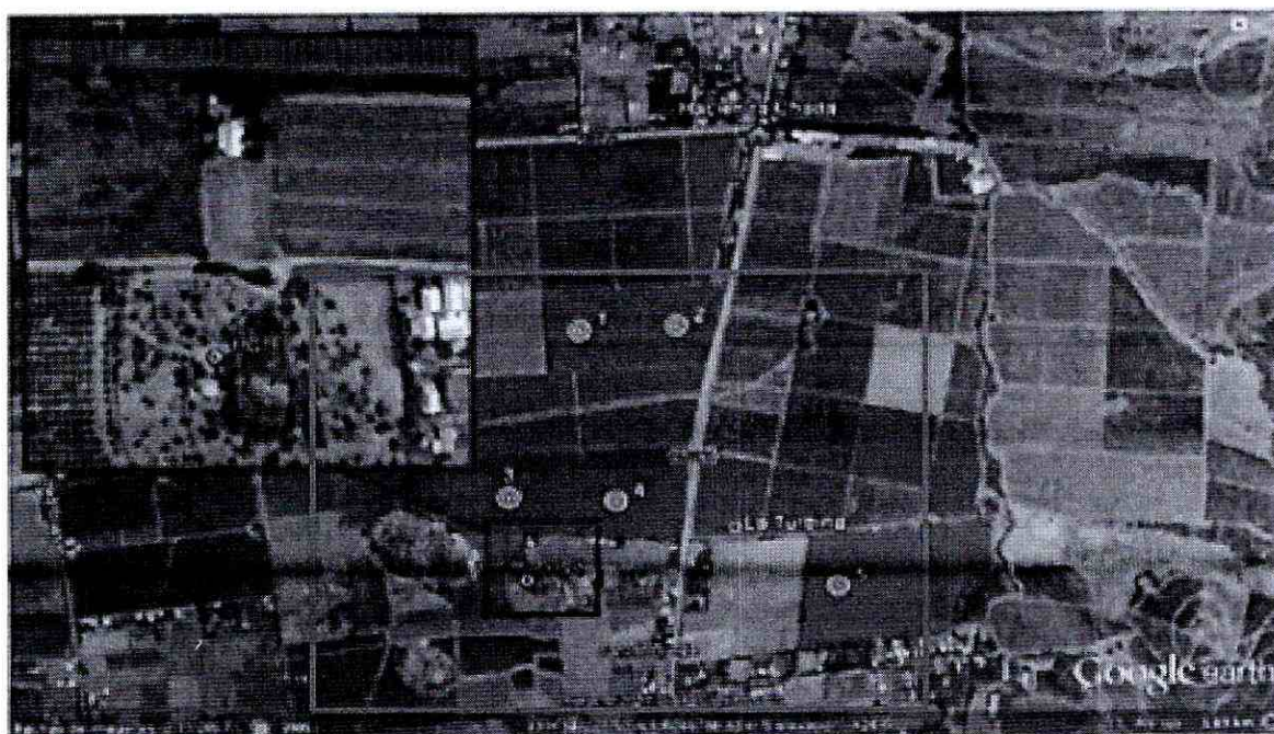
Figura N°1. Ubicación Receptor Sensible

Fuente: Figura N°1. Ubicación del receptor sensible, turbinas y oficinas administrativas de la titular. Res. Ex. N°1/D-028-2018 SMA.