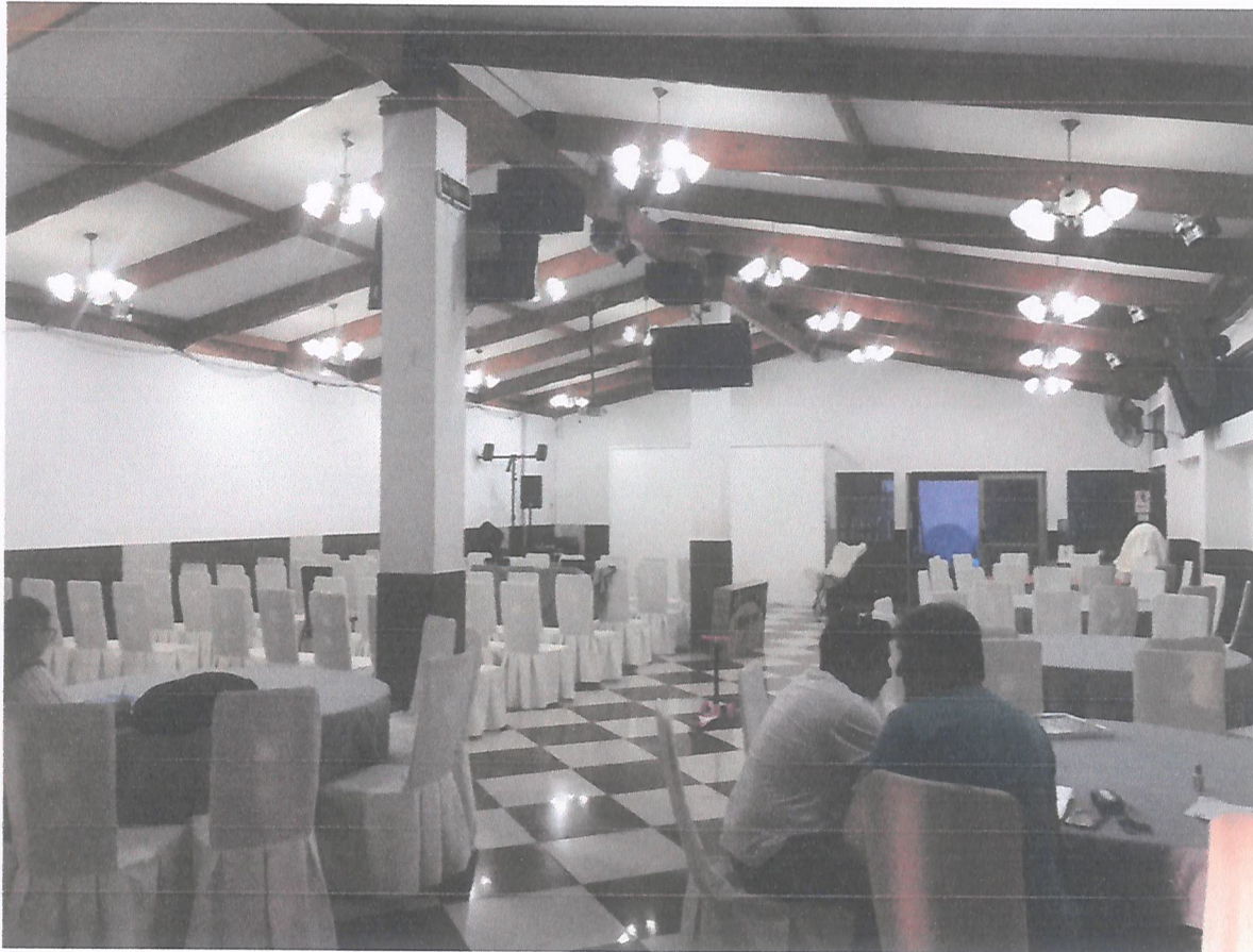
IMAGEN 1: Dos parlantes suspendidos en la viga del techo y en el fondo parlante cercano a la zona de DJ. Todas las fotografías fueron tomadas el día 12 de Diciembre de 2019, en Salón de Eventos Cayros ubicado en calle Manuel Rodríguez número 977.