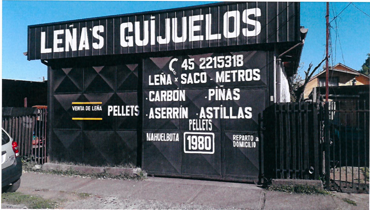
Exterior del local ubicado en Nahuelbuta N° 1980, Temuco.