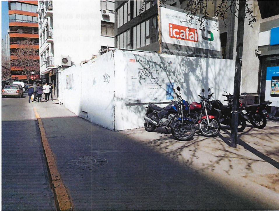
Fotografía: Cierre Perimetral lado Norte con calle Santa Magdalena.