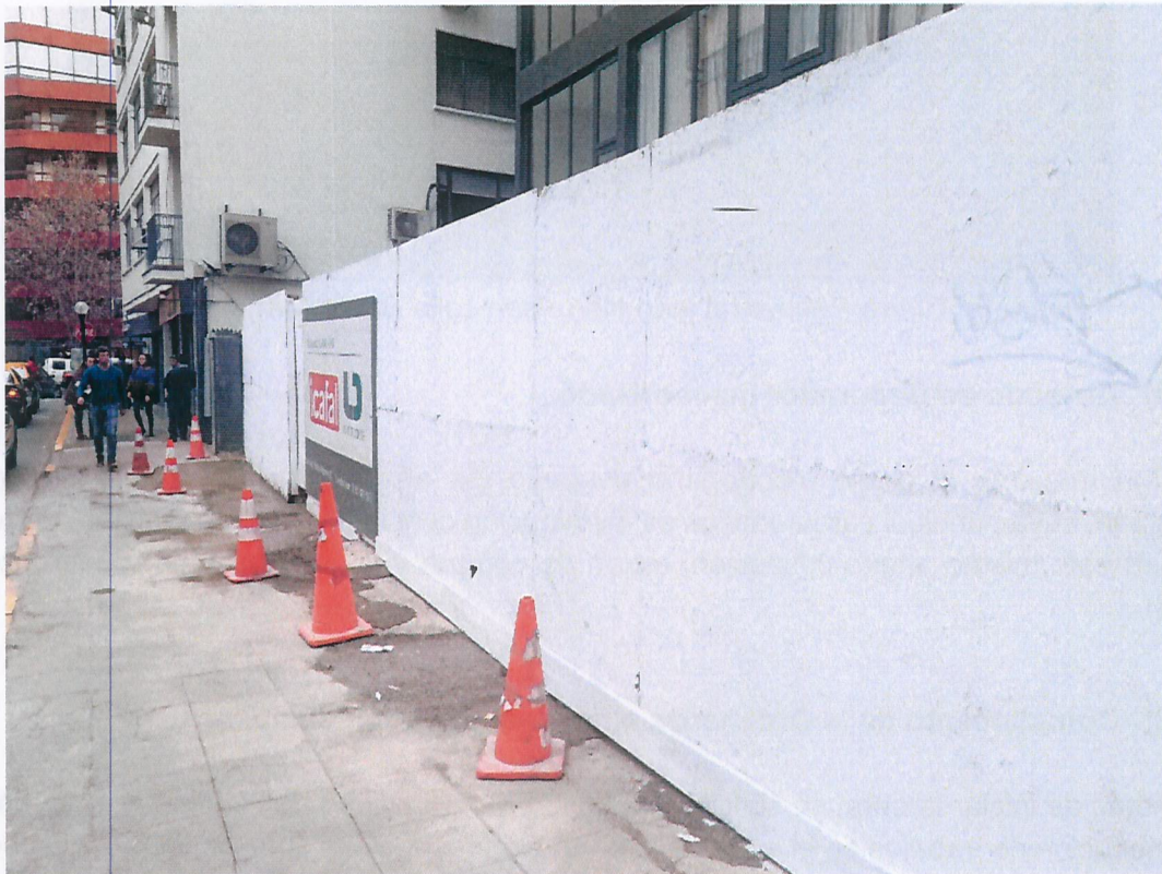
Fotografía: Cierre Perimetral lado calle Santa Magdalena

Se realizó la construcción de un cierre perimetral alrededor de la obra, con placa OSB de 15 mm, con el fin de disminuir la emisión de ruido. (Ver Fotografías)