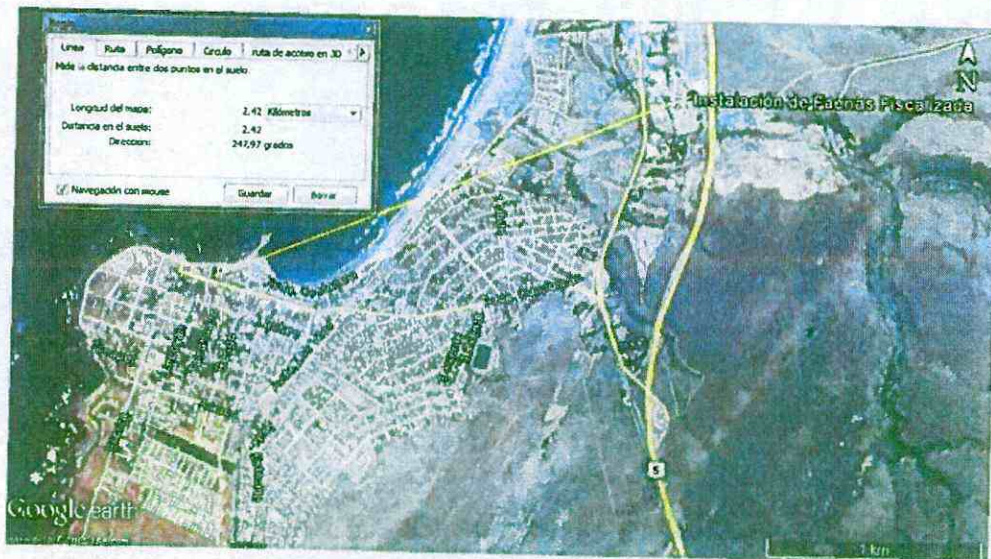
Imagen N° 2 Distancia de IF Los Vilos a centro poblado más próximo