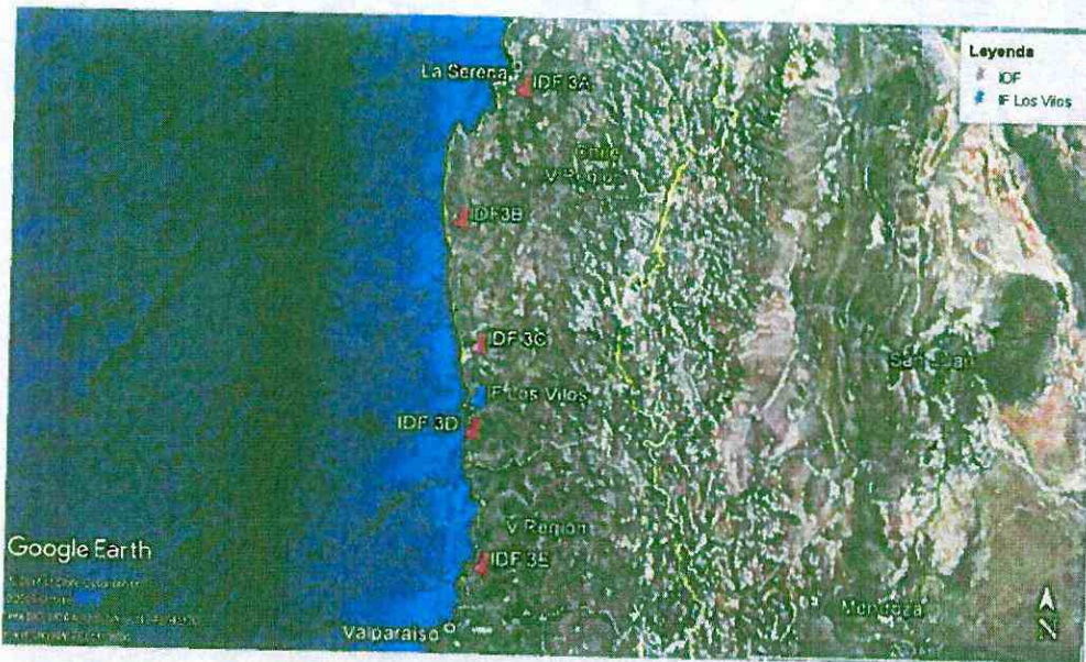
Imagen N° 1 Ubicación de las instalaciones de faenas autorizadas y la IF Los Vilos

incumplimiento a las condiciones establecidas durante la evaluación ambiental del Proyecto en cuanto a la localización y características de las instalaciones de faena asociadas al Lote 3, infringió los criterios utilizados para la justificación de la localización de las instalaciones de faena y campamentos, de conformidad a la Sección 1.14 del Informe Consolidado de Evaluación (en adelante, "ICE"), al encontrarse a menos de 4 km de distancia de un centro poblado, esto es, la localidad de Los Vilos. Lo anterior, puede apreciarse en las siguientes imágenes: