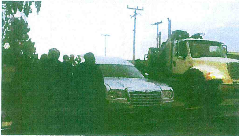
Imagen N° 3. Cortejo fúnebre en Cementerio de Los Vilos