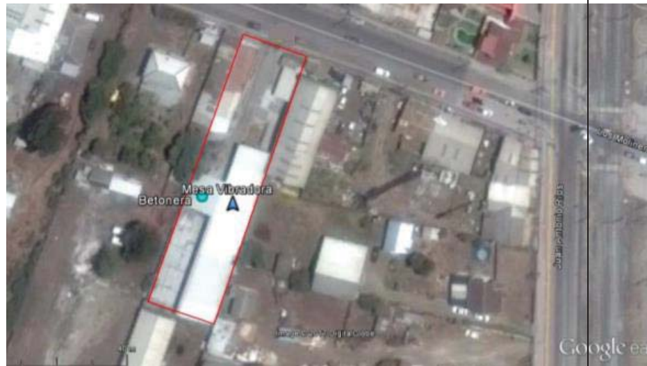
TABLA N°1: Leyenda IMAGEN N°1