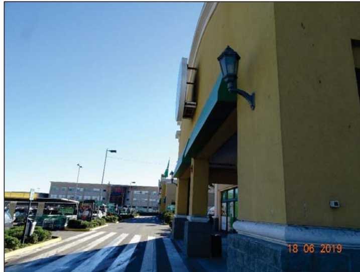
Imagen 6. Vista general Luminaria N° 5, sector entrada supermercado Jumbo