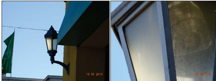
Imagen 7. Acercamiento Luminaria N° 5.