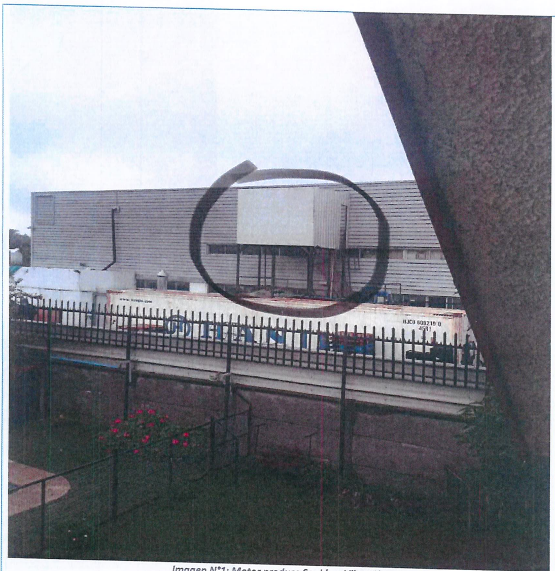
Imagen N°1: Motor produce Sonido y Vibración