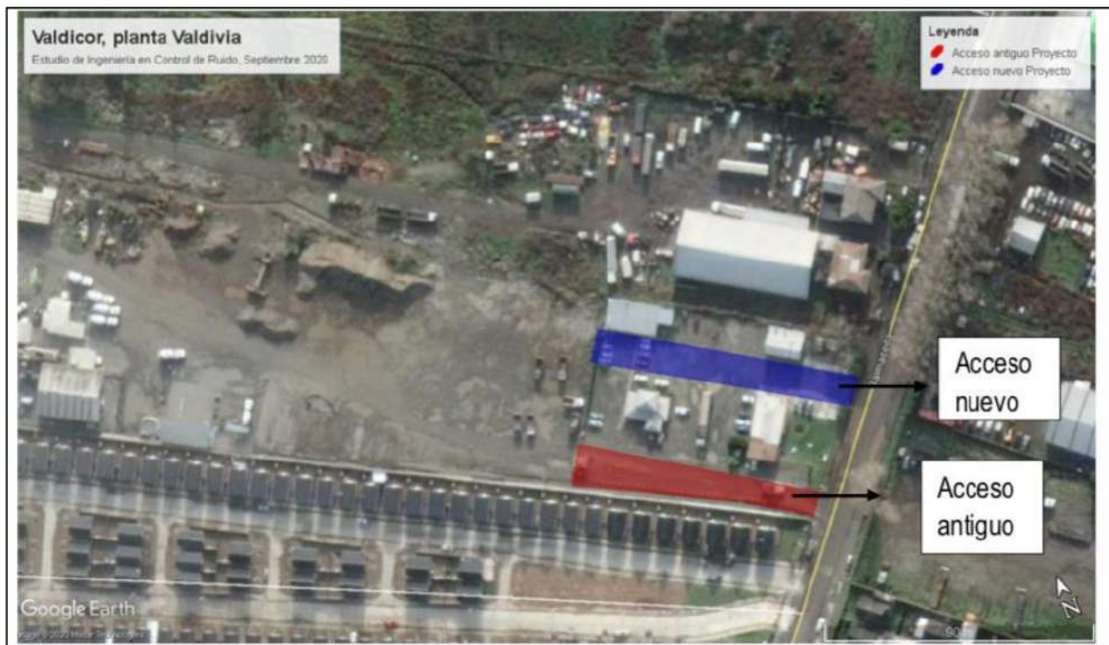
Figura Nº1: Vista satelital de caminos de acceso a la planta.

Al respecto, cabe señalar que dicha medida ya se encuentra ejecutada y operativa, tal como se muestra a continuación: