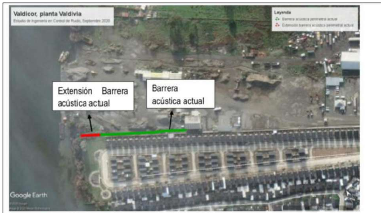
Figura N°3: Esquema de emplazamiento de extensión de barrera acústica actual (color rojo).

Se extenderá la barrera acústica existente de 6 metros de altura en 22 metros de longitud hacia el río. La extensión se instalará al menos a 3 metros del muro del límite predial (ya que no cuenta con muro medianero). A continuación, se presenta un esquema de emplazamiento de la barrera y una tabla con las coordenadas del emplazamiento de la barrera acústica.